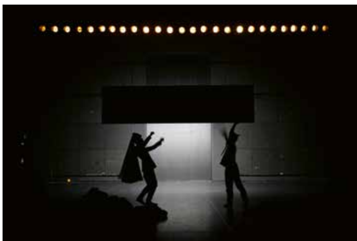
Bild ur The Extended Version of Nothing , Skånes dansteater.