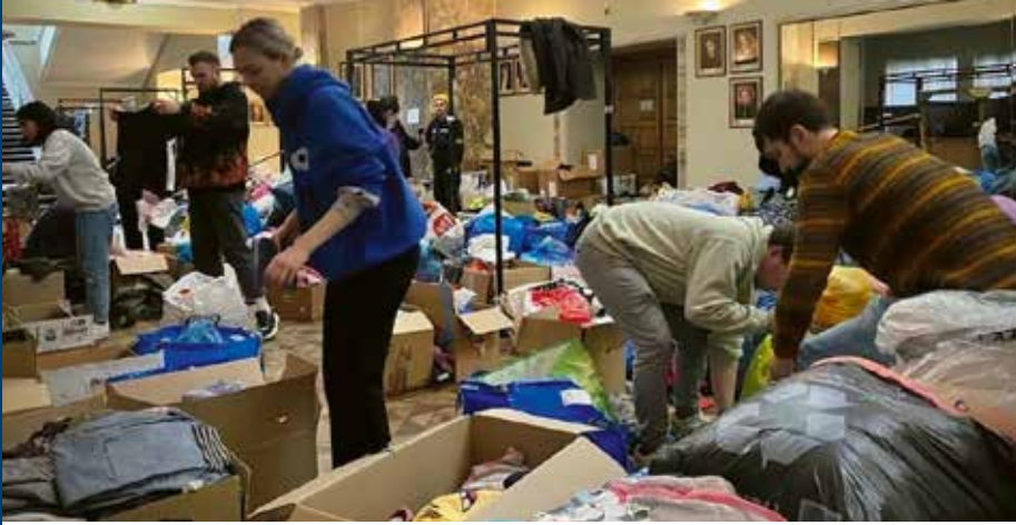
Maria Zankovetska-teatern i Lviv har blivit volontärcentral.