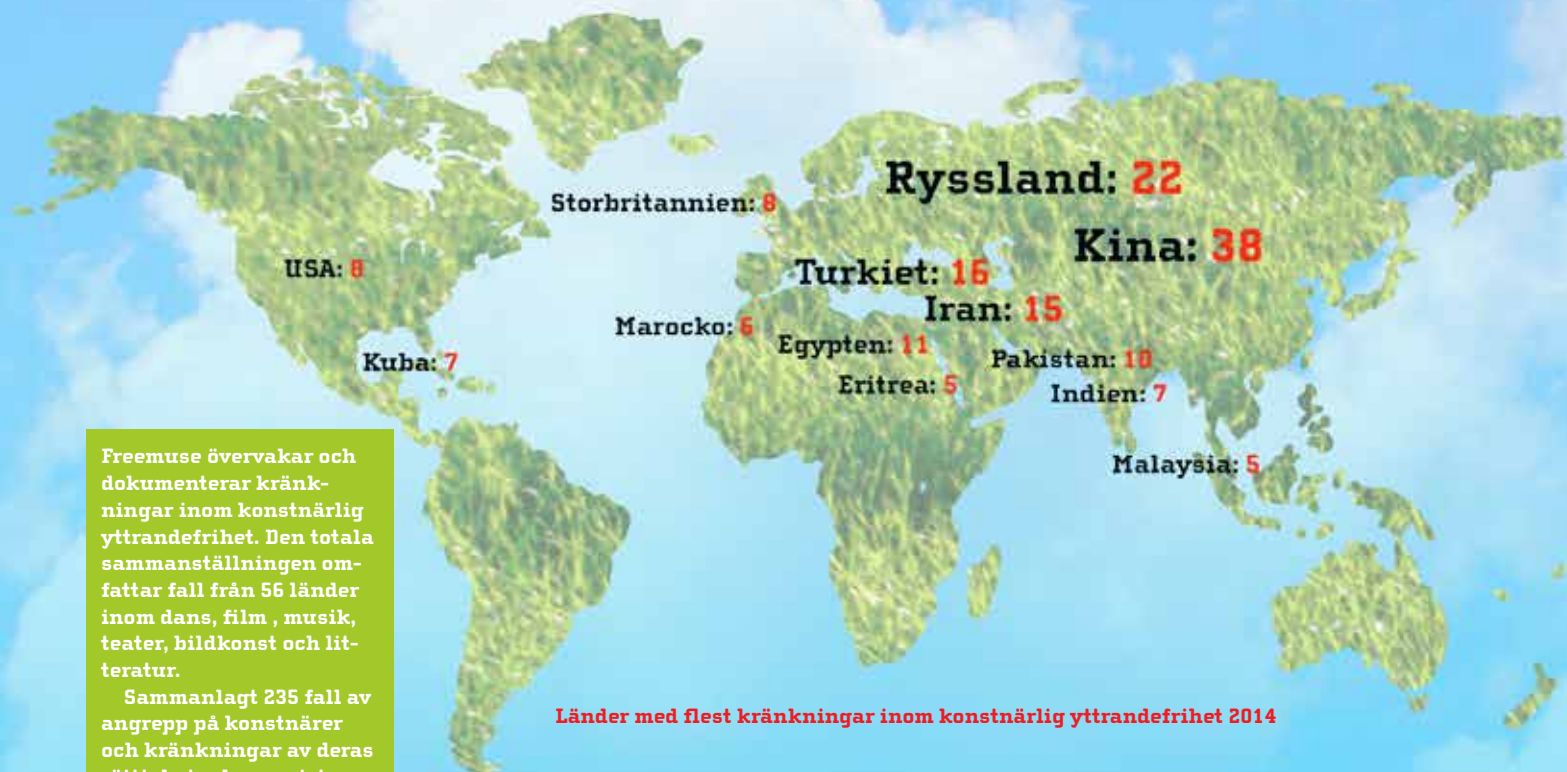
Länder med flest kränkningar inom konstnärlig yttrandefrihet 2014

Många artister förföljs och censuren växer i länder som Turkiet, Kina och Ungern. Inför det nya året går Teaterförbundets tankar till alla förföljda artister världen över.