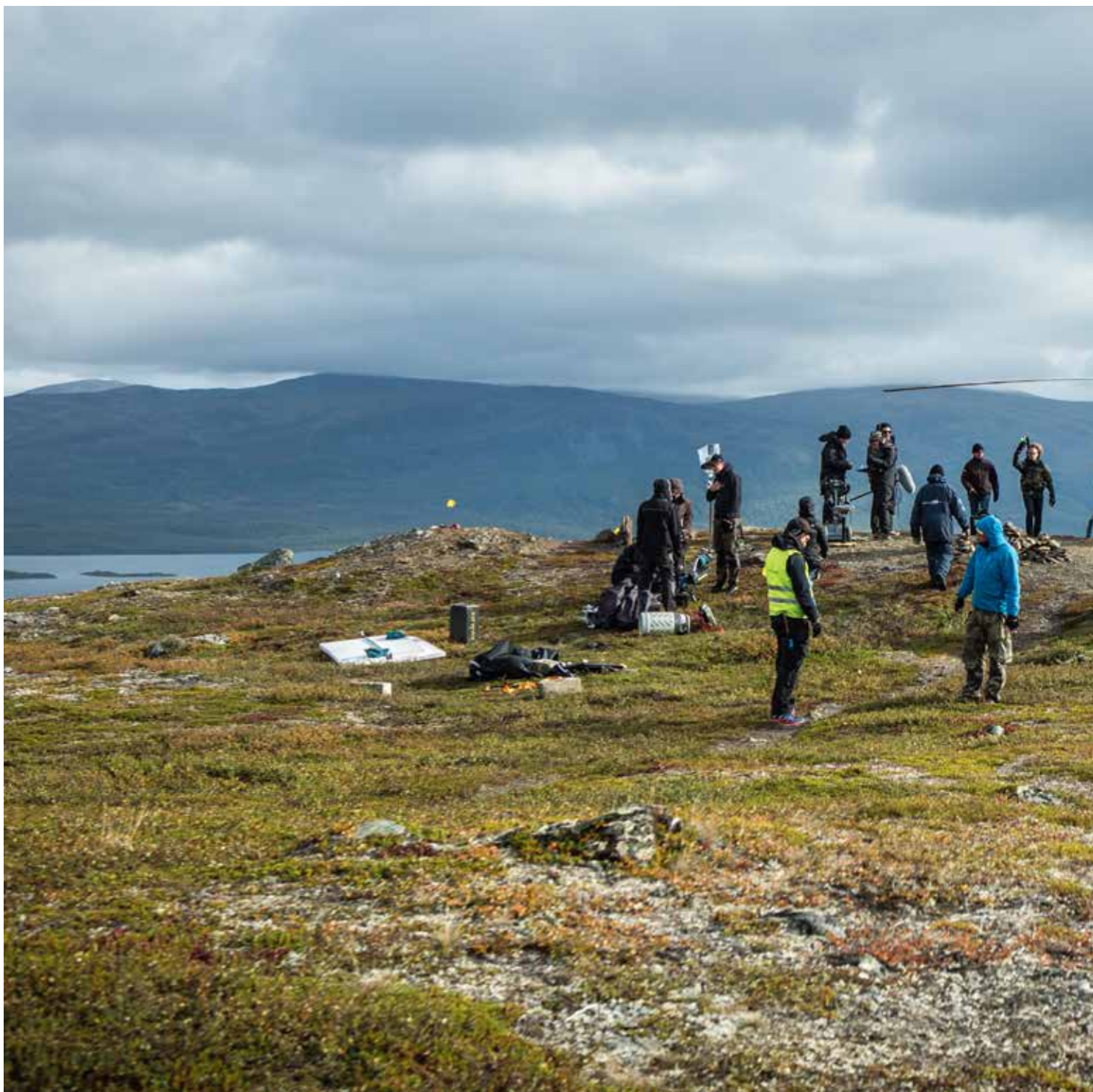
Bild från inspelningen av filmen Midnattssol.

säger han. Att fasiken vad smidigt det är att filma i Norrbotten.