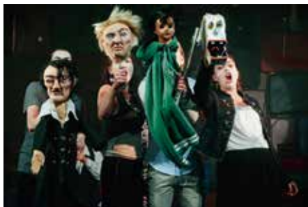
Scenkonst Sörmlands uppsättning av Romeo & Julia

Bara Frankrike har fått mer. Dessutom har nio projekt inom animation, dokumentär och fiktion beviljats utvecklingsstöd i den senaste omgången. Därmed placerar sig Sverige högst upp på listan både vad gäller antalet projekt och mängden stödpengar.