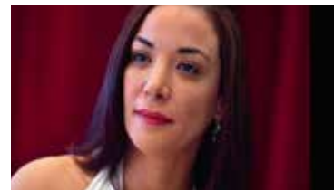
Loubna Abidar, en av många förföljda artister. Läs mer på baksidan.

En hatkampanj mot den marockanska skådespelerskan Loubna Abidar har fått henne att fly sitt hemland. Nyligen misshandlades hon av okända på en gata i Casablanca, själv säger hon att ansvaret ligger hos myndigheterna.