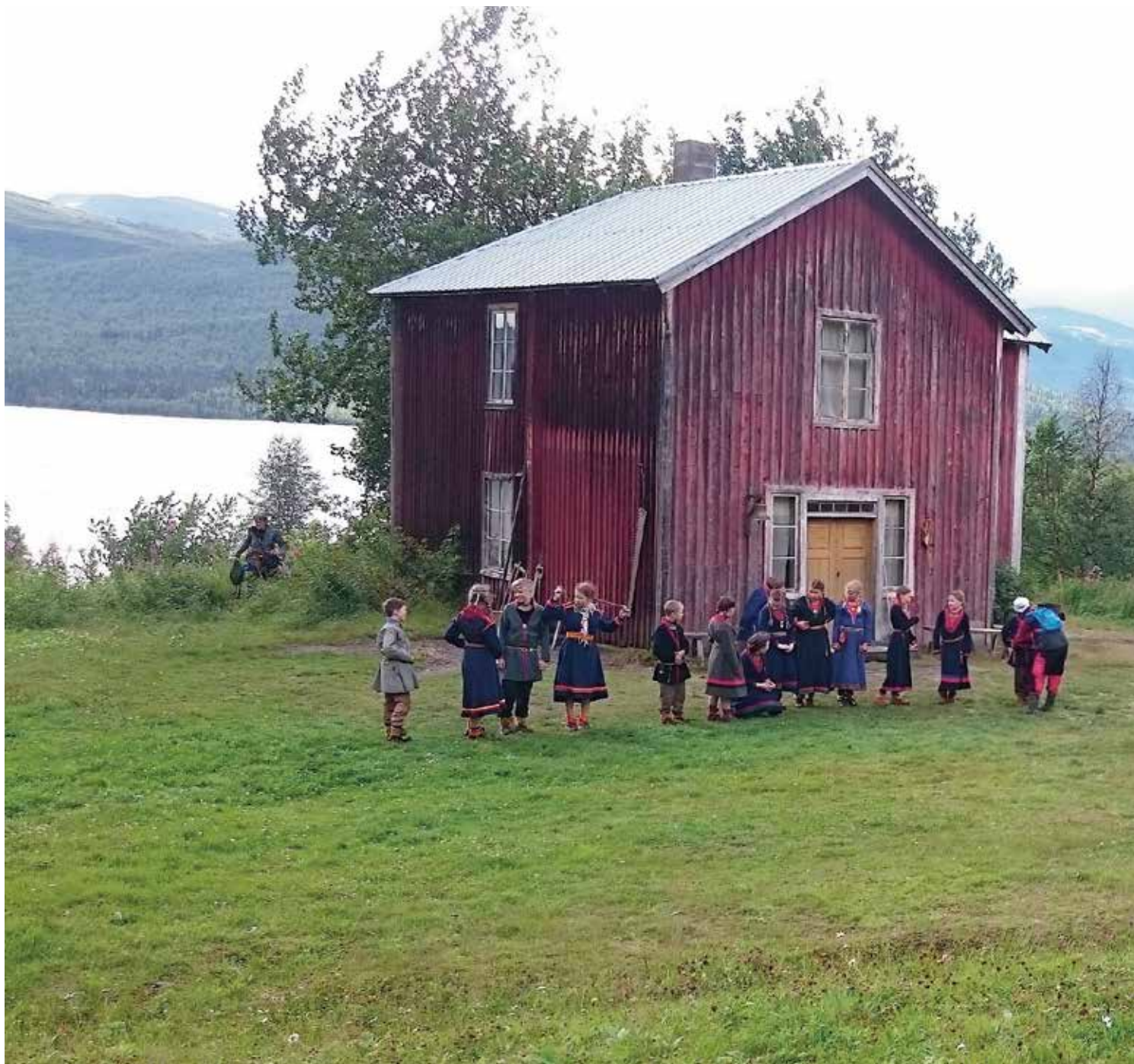
Bild från inspelningen av Sameblod.