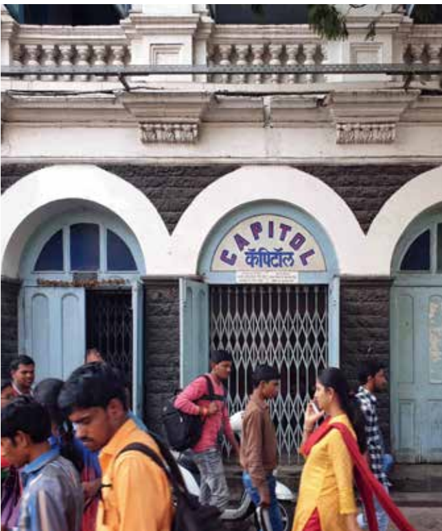
Mumbais äldsta biograf.