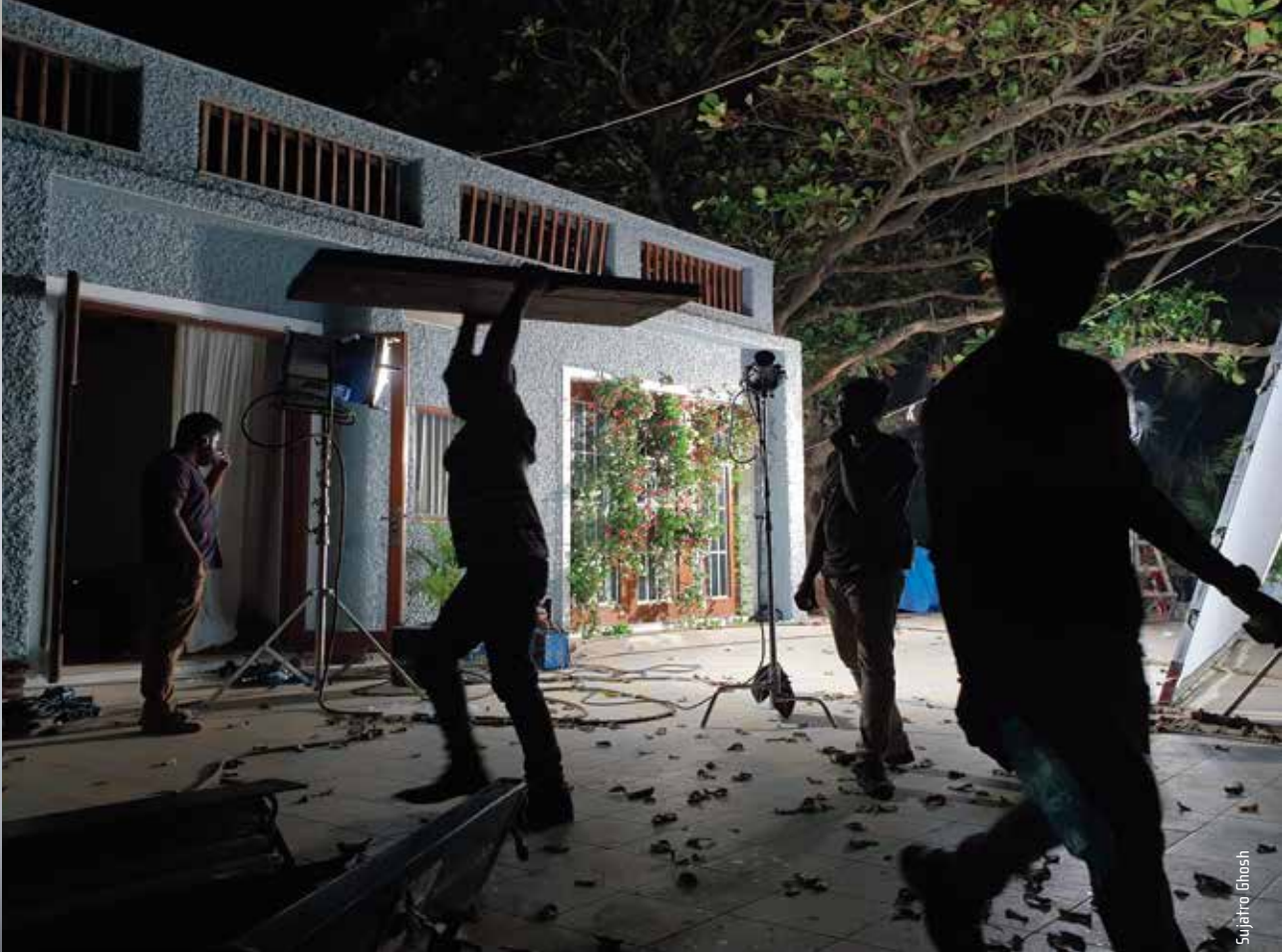
Inspelning av en Bollywoodproduktion.