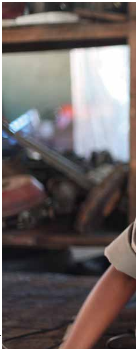
Real Eyes Films

I Sydafrika har skådespelarfacket Saga och Swift – Sisters working in film and television – gemensamt producerat en utbildningskampanj för att uppmärksamma folk på sexuella trakasserier.