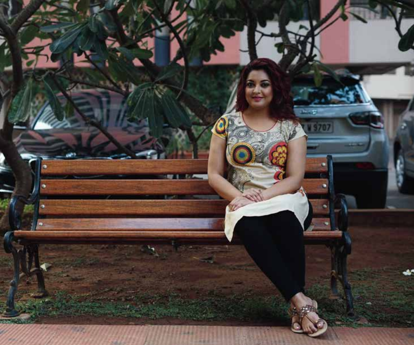
Tanushree Dutta har idag lämnat filmvärlden helt.