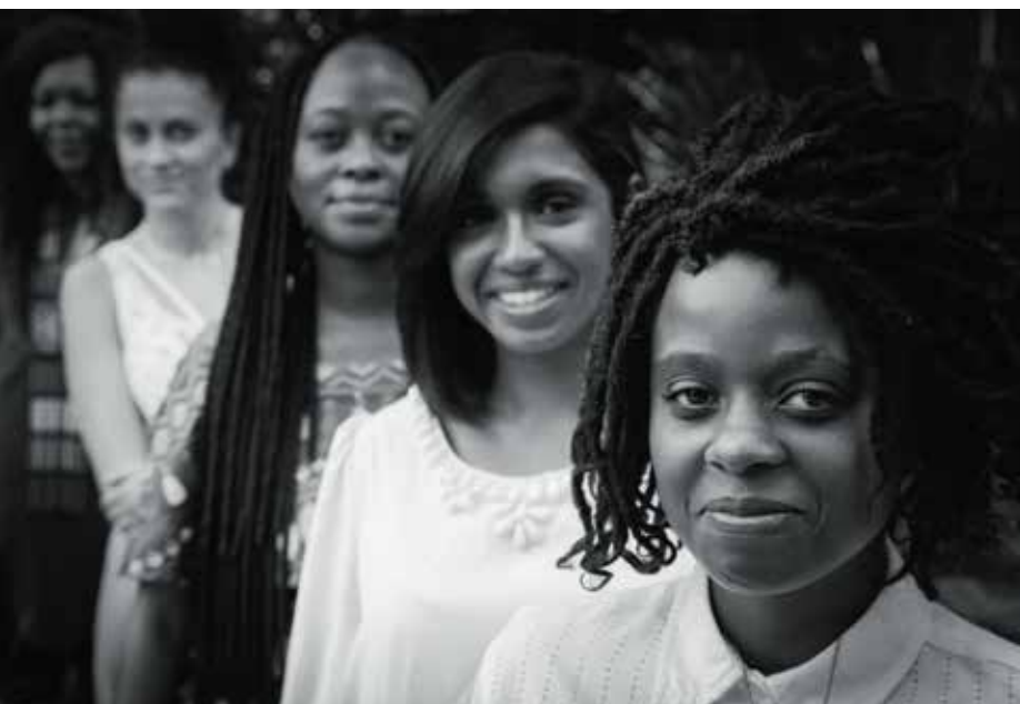
Kampanjbild från Swift.

I Sydafrika har skådespelarfacket Saga och Swift – Sisters working in film and television – gemensamt producerat en utbildningskampanj för att uppmärksamma folk på sexuella trakasserier.