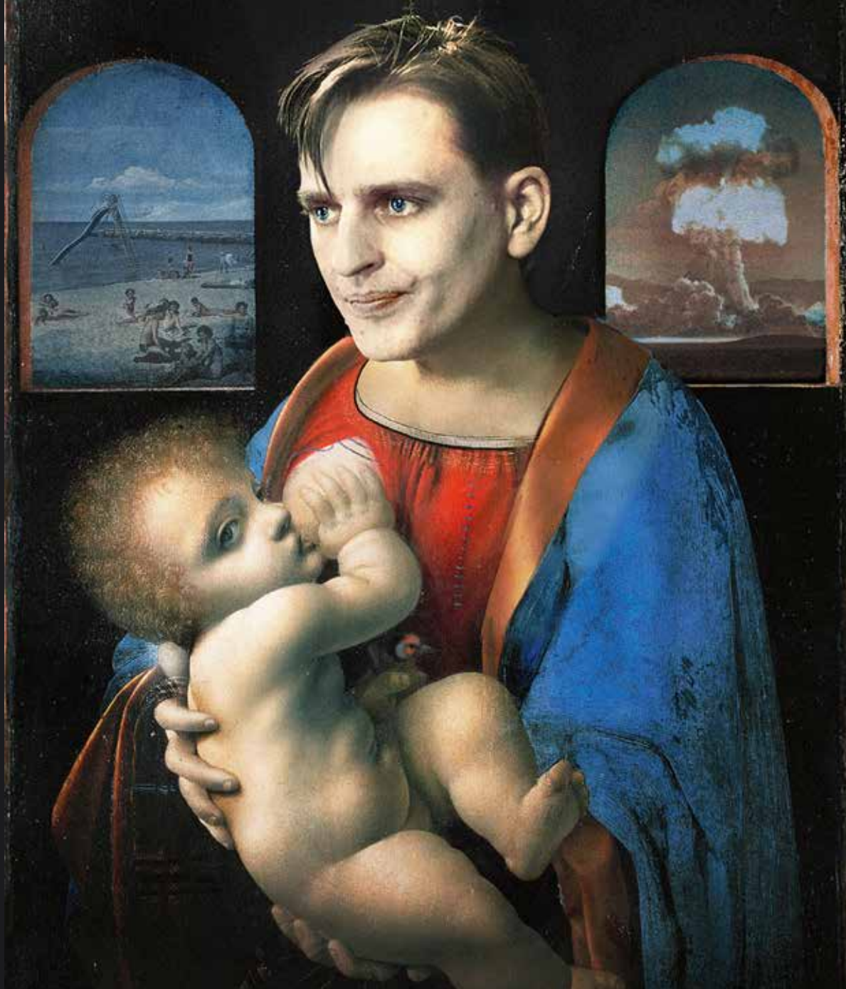
Formgivare: Jan Larsson

Affischbilden för Teater Galeasens Ur svenska hjärtans djup .