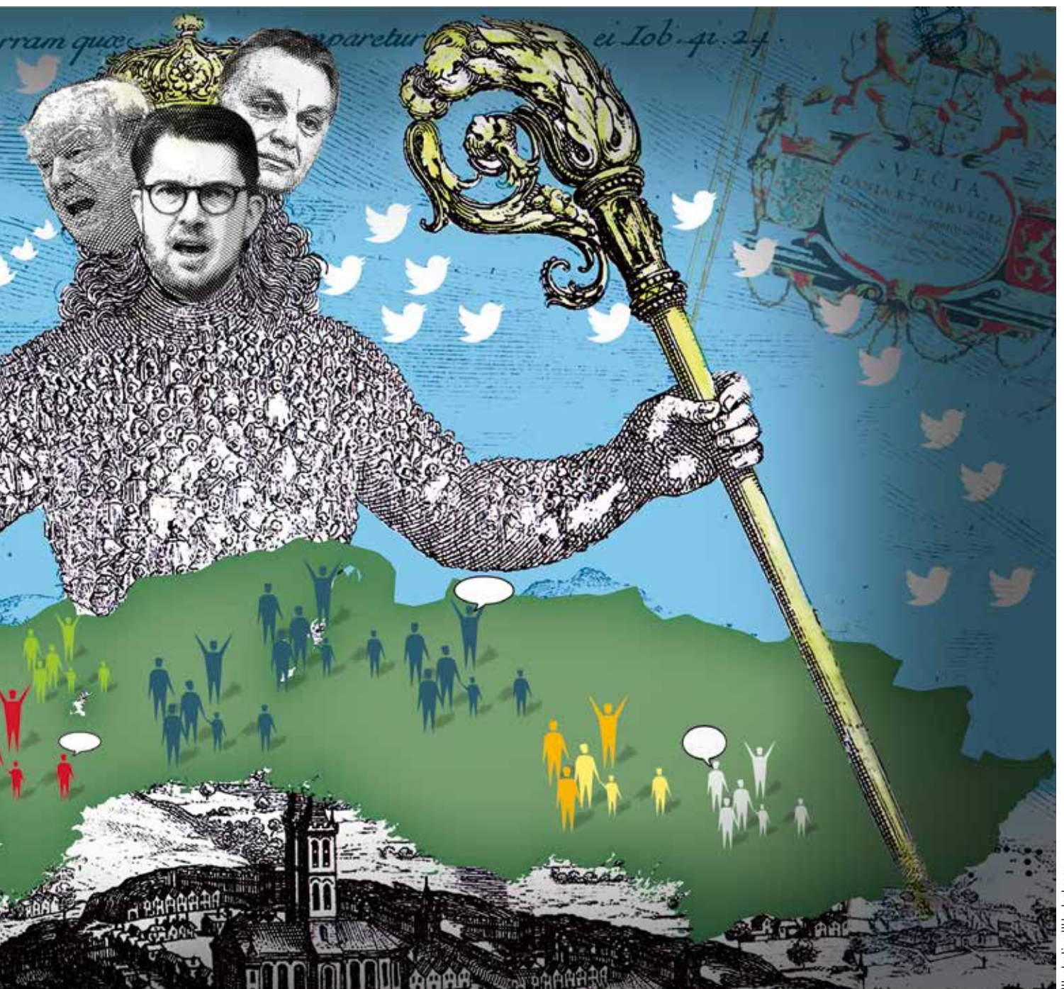
Illustration Ilkka Isaksson

Vi ville lägga örat mot marken och lyssna. Mullrade det där ute?