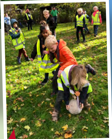
Foto boven en rechts: te gast bij de Rangers; Foto links: over het water terug naar het clubhuis tijdens najaka.

een theezakje en hadden de opdracht het te ruilen voor iets dat groter is dan het theezakje. Het groepje dat uiteindelijk het grootste voorwerp had won. Er kwamen lange touwen, bezems, pvc-buizen, een helm, paraplu en nog meer bijzondere voorwerpen terug naar het clubhuis. In het voorjaar komen de Rangers bij ons op bezoek.