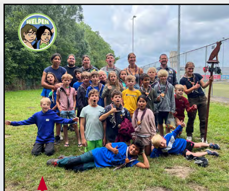
Groepsfoto welpen zoka23 'De vloek van de Farao'