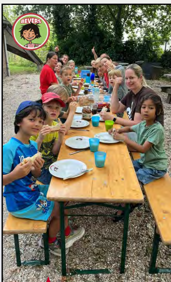
De bevers aan het ontbijt tijdens hun zoka23 'De Wolf en de 7 Bevertjes'.

Zie hieronder een foto-overzicht van alle kampen. Op de pagina's verderop kunt u de verslagen lezen.