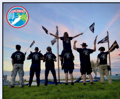
Groepsfoto WiVa zoka23 'Piraten van de Kaag'