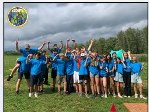
Groepsfoto zoka23 zeeverkenners 'De Smurfen'