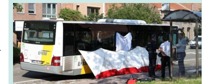
De bus van De Lijn werd afgeschermd.

In de Oude Godstraat in Edegem is gisteren een passagier van een lijnbus om het leven gekomen. De 85-jarige man kwam zwaar ten val in de bus toen de buschauffeur bruuks in de remmen moest door een bestelwagen. Dat bevestigd De Lijn. Het incident gebeurde rond 9.15u op een bus van lijn 91 tussen Mortsel en Berchem station. “De buschauffeur heeft een noodstop moeten uitvoeren voor een witte bestelwagen die zijn voorrang nam over een volle witte lijn. Daarbij kwam een passagier op de bus zwaar ten val”, vertelt woordvoerder Karen Van Der Sype van De Lijn.