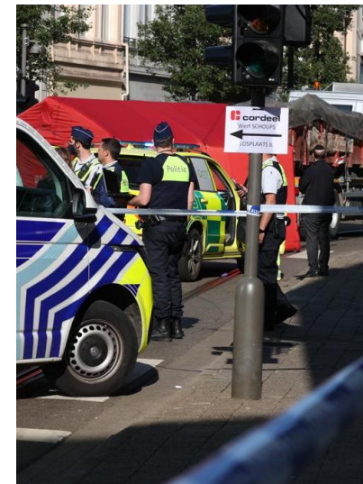
Net na het ongeval werd de omgeving afgesloten.

Districtschepes “Het ongeval raakt heel onze gemeenschap. Al heel de dag krijgen we van overal oproepen voor therapeutische bijstand.”