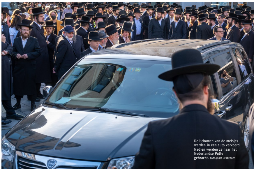
De lichamen van de meisjes werden in een auto vervoerd. Nadien werden ze naar het Nederlandse Putte gebracht.

voor hen was de wonde nog te vers”, zegt Markowitz. “Het ongeval raakt heel onze gemeenschap. Al heel de dag krijgen we van overal oproepen voor therapeutische bijstand. Ook de komende dagen zullen we onze handen vol hebben.” (sare, cel, jtp, syma, nelo)