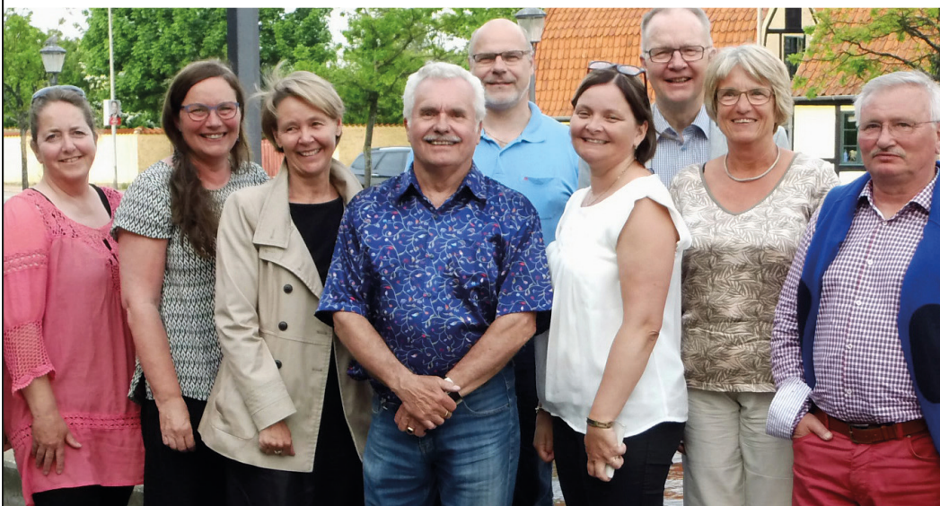
Billede af Skælskør Lokalråd 2014/2015: