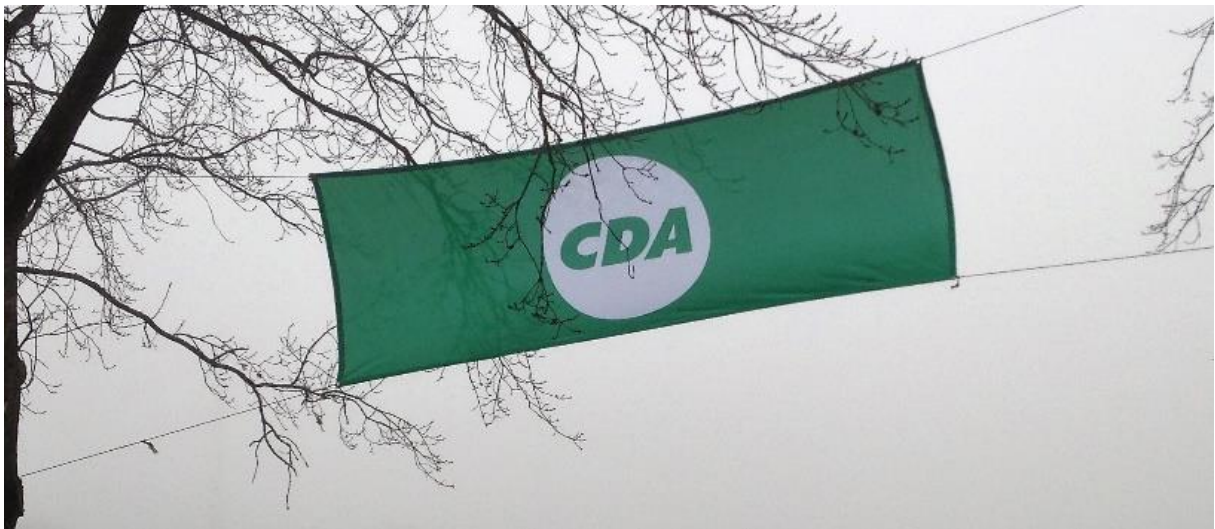
Vastgesteld in de ledenvergadering van woensdag 25 oktober 2017