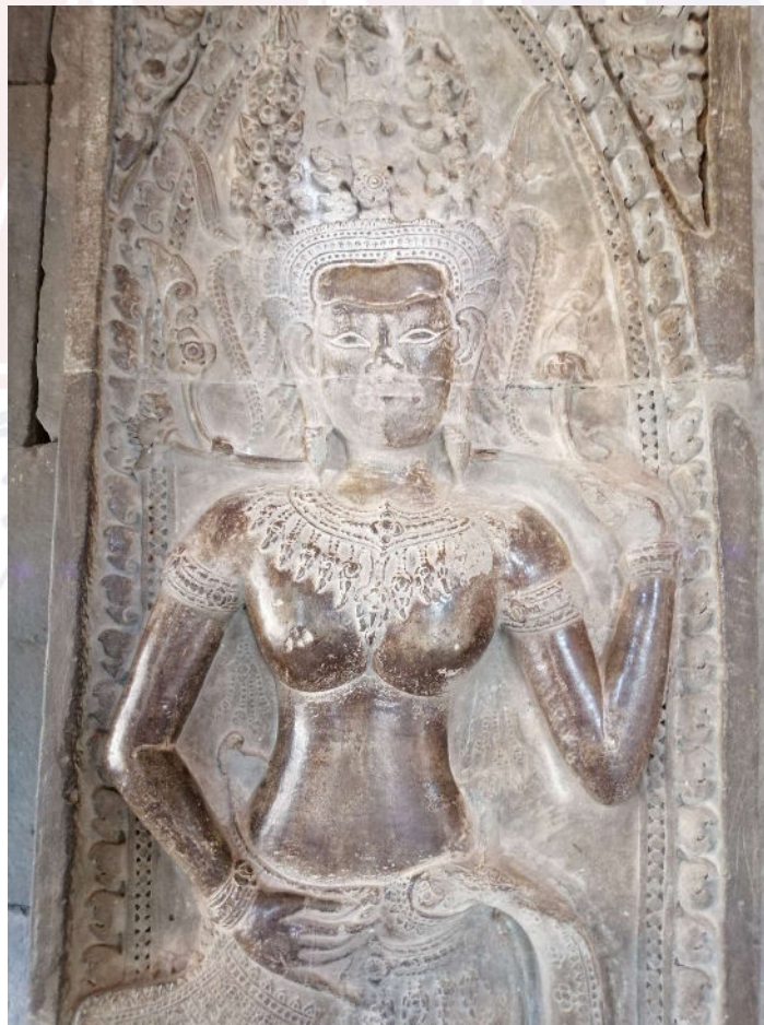
រូបលេខ៣៖ ចម្លាក់រូបទេពអប្សរនៅលើជញ្ជាំងអាគ្នេយ៍របស់អគារមណ្ឌបខាងលិច (រចនាបថអង្គរវត្ត)