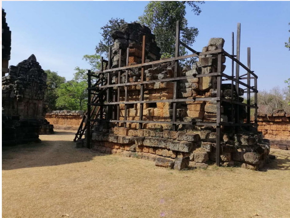
រូបលេខ៣៖ អគារខាងកើត ជ្រុងឥសាន្ត ធ្វើពីថ្មភក់និងថ្មបាយក្រៀម