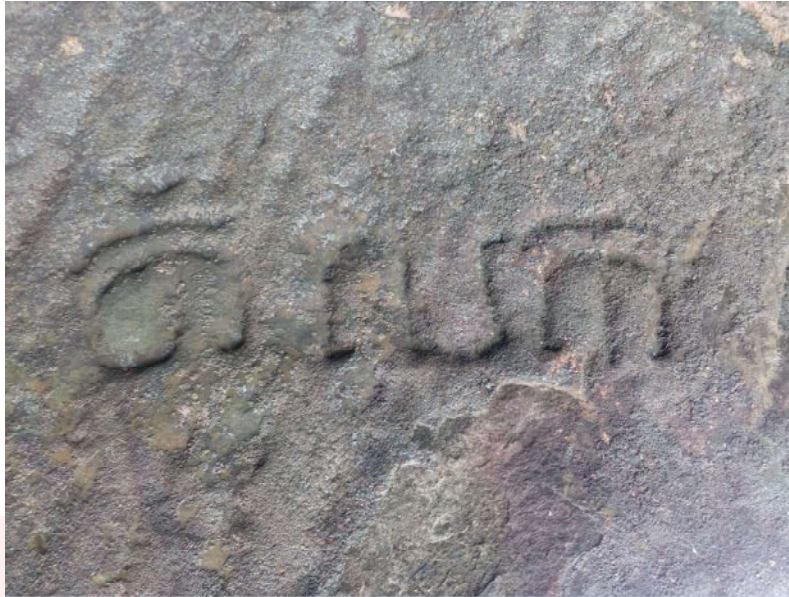
រូបលេខ៨៖ អក្សរលើថ្មមិនទាន់ធ្វើរួច (តលក)