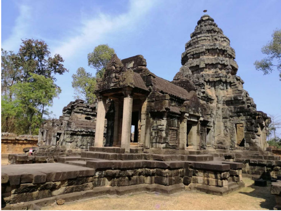
រូបលេខ២៖ ប្រាង្គកណ្តាល និងកំពូលមានរូបរាងដូចកំពូលប្រាសាទអង្គរវត្ត