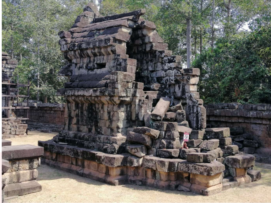
រូបលេខ៦៖ អគារខាងលិច ជ្រុងអាគ្នេយ៍ ធ្វើពីថ្មភក់