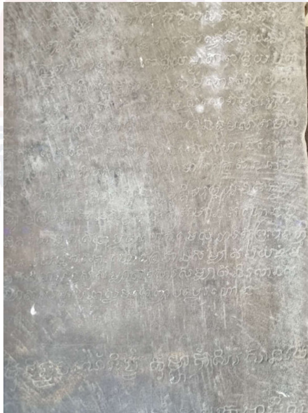
រូបលេខ៧៖ សិលាចារឹកសម័យកណ្តាល នៅលើសសរខាងក្នុងសំណង់មណ្ឌប