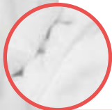
Coral Fleece Polarowy