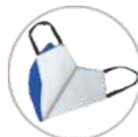
BIAŁA BAWĘLNA WHITE COTTON