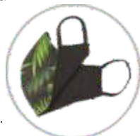
CZARNA BAWĘLNA BLACK COTTON

Maseczka profilowana wielokrotnego użytku z gumkami na uszy. Nadruk na całej powierzchni wykonany metodą sublimacji po zewnętrznej stronie. Wewnętrzna strona maseczki wykonana z materiału bawełna (biała lub czarna).