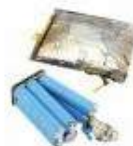
Naakte, gezwollen en beschadigde packs

BRENG ZE NAAR HET RECYCLAGEPARK OF BRENG ZE NAAR EEN PROFESSIONAL.