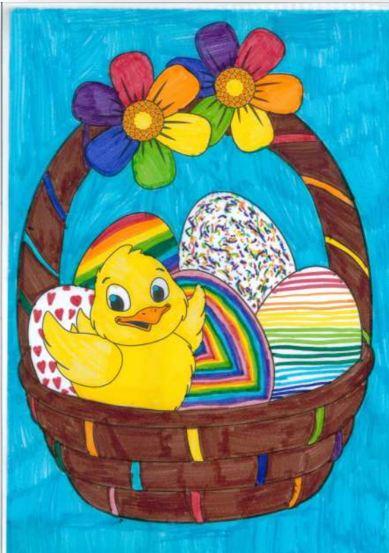
Noor Coppens 4LA