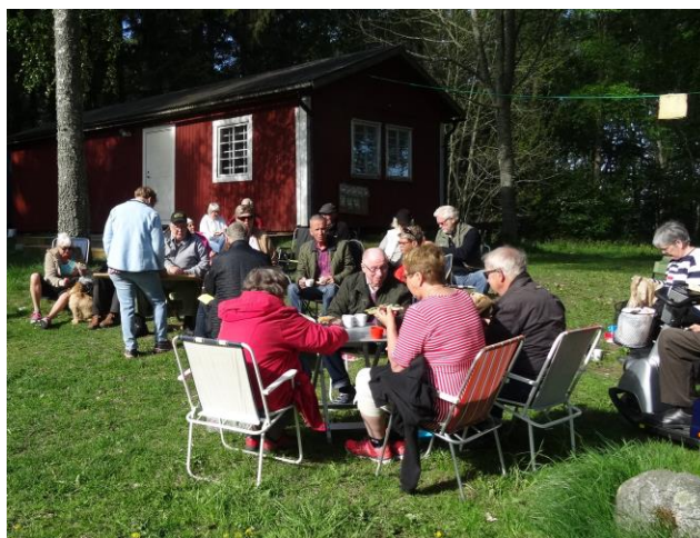
Fika i Tvärskogsudde

Morgonen den 25 maj samlades 27 personer vid Linsurfs anläggning på Tvärskogsudde. En frågesport på trädkunskap hade ordnats. Alla njöt av den medhavda matsäcken och naturens skönhet.