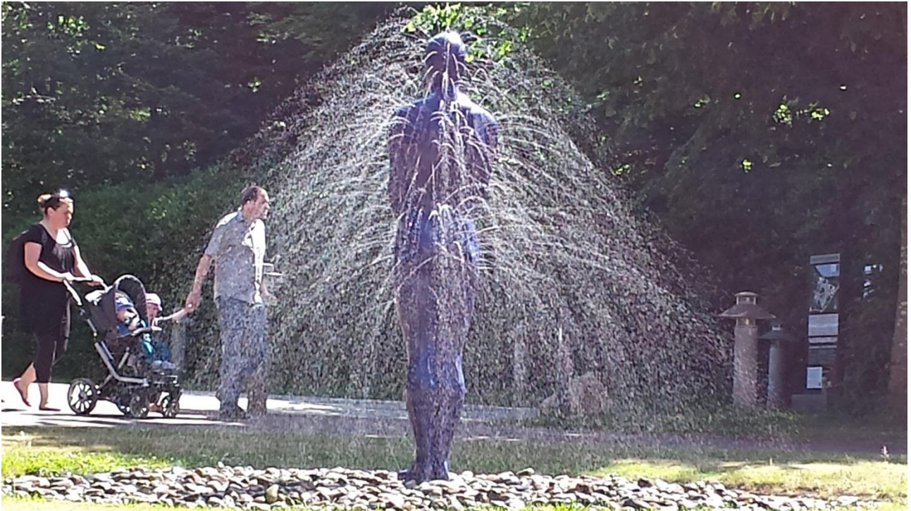
I 2014 – den anden sommer på Silkeborg Bad – var sommervejret perfekt og besøgstallet fint.