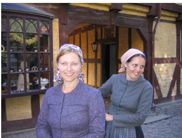
To Randers-fortællere forklædt som vaskekoner.