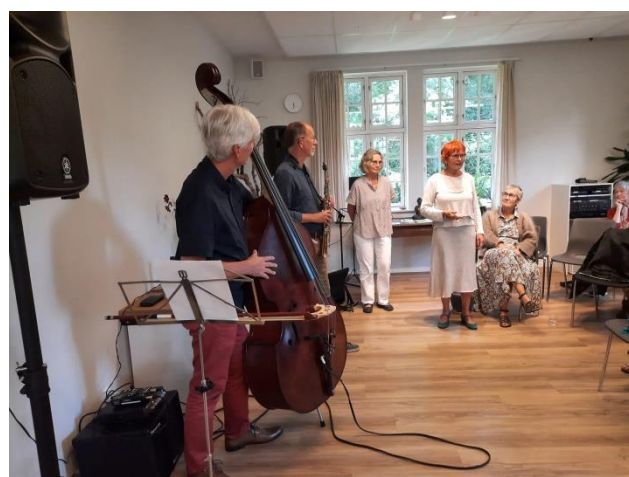
Sammenkomst med fortælling på Himmelbjerggården.