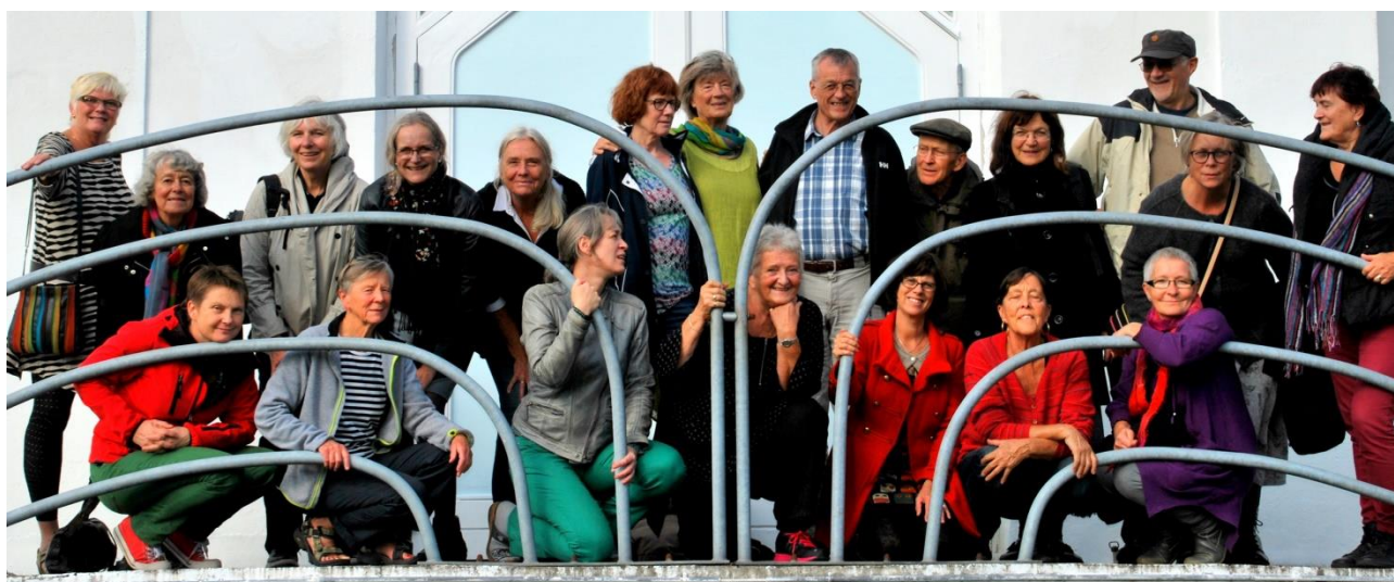
Fortællere fra nær og fjern på sightseeing i Audonicon i Skanderborg.

Dagen begyndte med fælles morgenmad og opvarmning, og så gik det løs med fortællingerne lige til det mørkede, og alle gik hjem med hovederne fulde af fortællinger og maverne fulde af linsesuppe. Det blev aftalt, at kredsene skulle gøre det fælles træf til en tilbagevendende begivenhed. Det lykkedes dog ikke at få etableret den tradition, men det gjorde ikke dagen ringere.