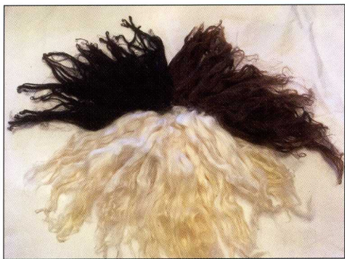
Ryans långa glansiga ull i flera olika färger är rasens kännetecken.