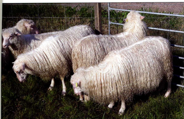
En fantastisk glänsande ull som hänger ner på sidorna som en "kjol", ryafåren är mycket vackra djur.

arna vi får in går tillbaka för olika nya insatser och investeringar för fåren.