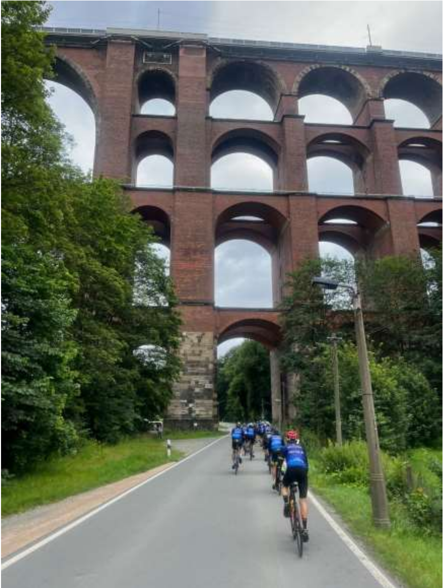
Ergens onderweg. De Göltzschtalbrücke, de grootste bakstenen brug ter wereld uit 1851. 78 meter hoog.