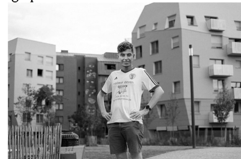
(n.v.d.r. Op het moment van publicatie was deze transfer nog niet rond) Kai Havertz in het shirt van Atalanta: Ik ben erg blij voor zo'n mooie club te kunnen spelen.

Verwacht wordt dat het jonge talent wordt uitgeleend aan Chelsea om de nodige ervaring op te doen.