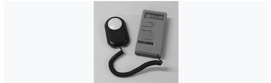
Afbeelding van een LUX meter

Voor onze vereniging is dit een zéér welgekomen ondersteuning!