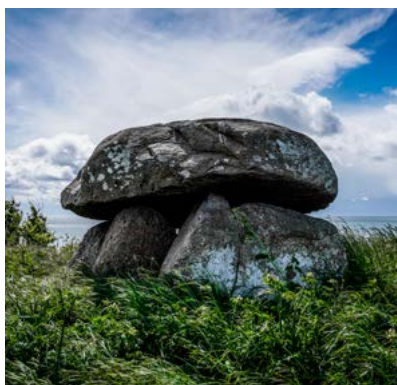
Den smukke stendysse Knøsen på Samsø.