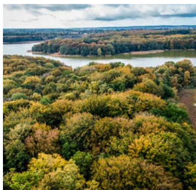
Store Ø ligger i Gurre Sø i Nordsjælland.

sport at tage ud på øerne og bare se, hvad jeg kunne finde, men det var ikke lige smart hver gang. Det betød f.eks., at jeg tog til Anholt uden at planlægge noget på forhånd, og her kom jeg til at gå ud i det område, der hedder "Ørkenen" uden mad og drikke, selvom der åbenbart alle steder stod, at man skulle huske at tage drikke med, hvis man tog derud. Jeg er ikke selv særlig struktureret som privatperson, så man kan sige, at hjemmesiden er mere struktureret, end jeg selv er, griner hun.