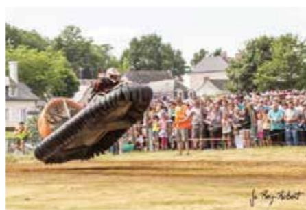
// TONY ÖSTERMAN Nummer: 527 Klass: Formel 2