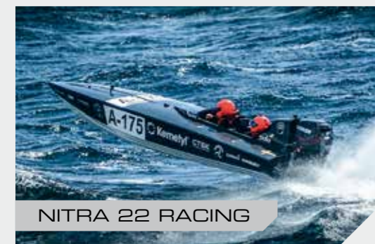
NITRA 22 RACING