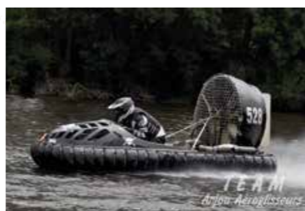
// HANS WESTERBERG, 50 ÅR Nummer: 528 Klass: Formel 2