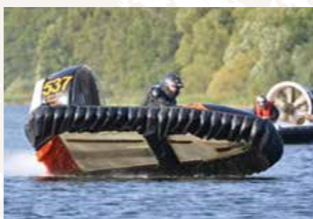
// BJÖRN HALL, 56 ÅR Nummer: 537 Klass: Formel 50