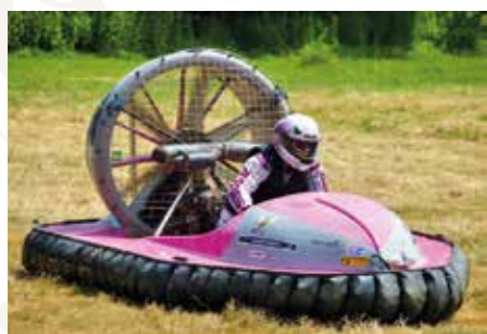
// MIA HAGSTEDT, 62 ÅR Nummer: 541 Klass: Formel Novice