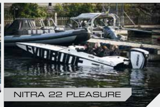
NITRA 22 PLEASURE