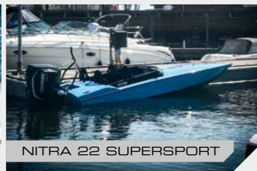
NITRA 22 SUPERSPORT