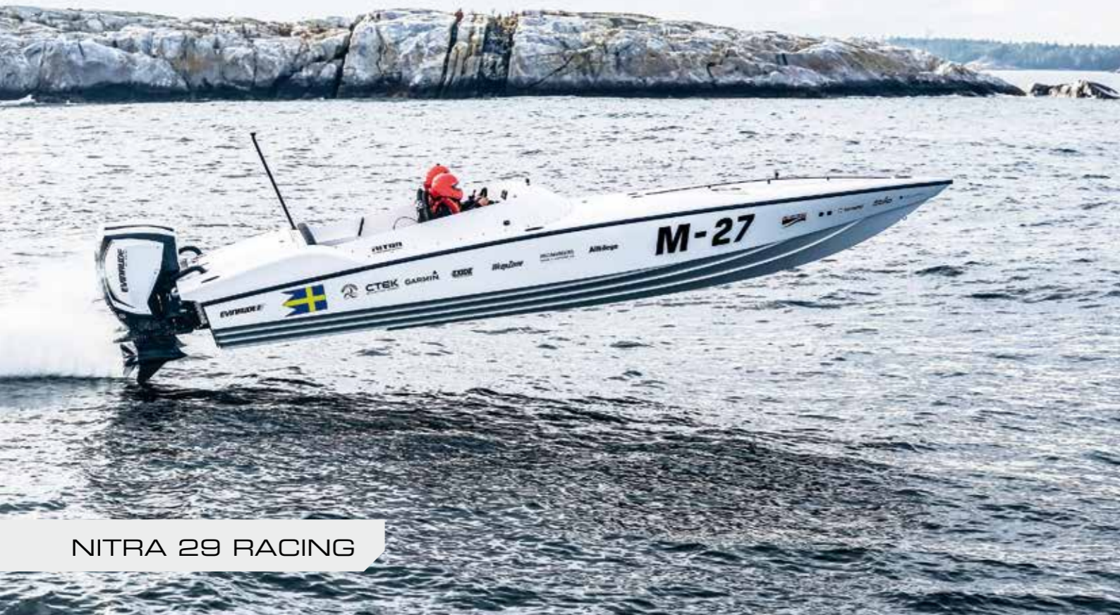
NITRA 29 RACING