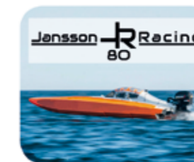
Jansson Racings tävlings- ekipage Katamaran twister 24 klass Offshore 3C.