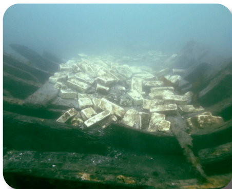
Her ses et billede af lastskibet fra starten af 1800 'Svælget 1' med resterne af sin last af gule teglsten ombord.

Svælget 2 er langt ældre end Svælget 1 og er forlist i middelalderen for ca. 700 år siden. Det er meget sjældent, at vi finder skibe fra denne periode. Så det bliver spændende at følge med, når marinarkæologerne tager hul på arbejdet med at bjærge skibet 'Svælget 2' i midten af maj.