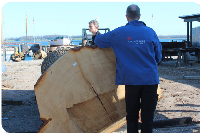
Den korte egetræsstamme bliver kløvet i juni og hugget til en af Skuldelev 5's stævne hen over sommeren.