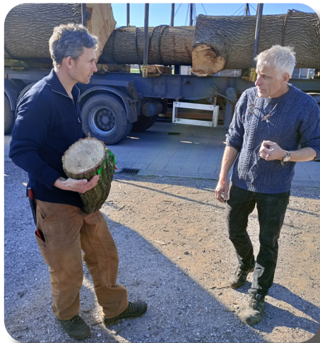
De store egetræsstammer og enkelte stykker krumtræ ankom til Museumsøen med lastbil 21. april.