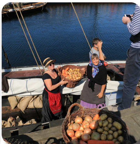
Grøntsager sejles ind