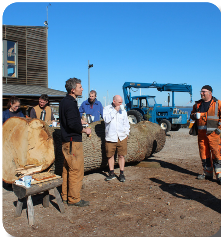
Bådebyggere og skovarbejdere fra Vallø Stift fejrer, at egetræerne endelig ligger klar foran værftet