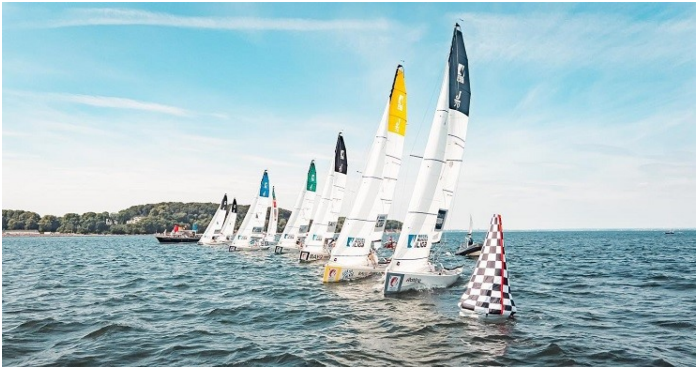
Starter i verdensklasse