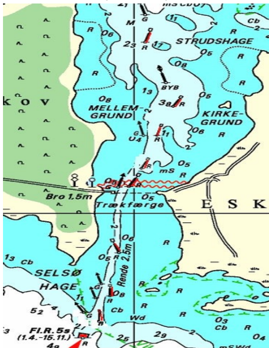
Skovrenden mellem Eskildsø og Østskoven på Selsø