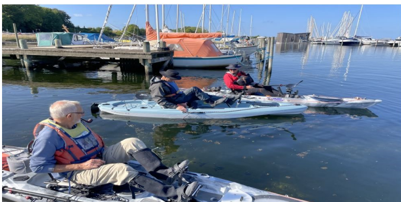
Seniormotion uden lige.