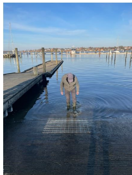
Stålriste på rampen