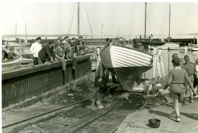
Søsætning af båd med beddingsvognen på slæbestedet – som det foregik i 1949

løfte igen på den anden side af tværvangen og videre til næste vange, indtil beddingsvognen var lirket fri af båden. Selv sagt kostede det en håndfuld bajere at få hjælp til det projekt. Havne søsætning Roskilde