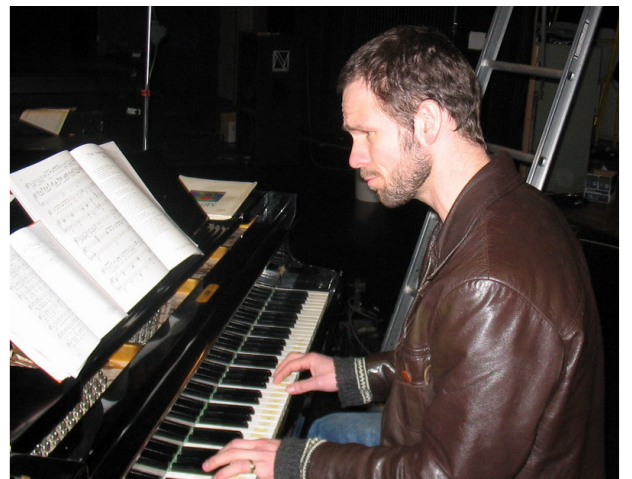
Hardt arbeid og slit