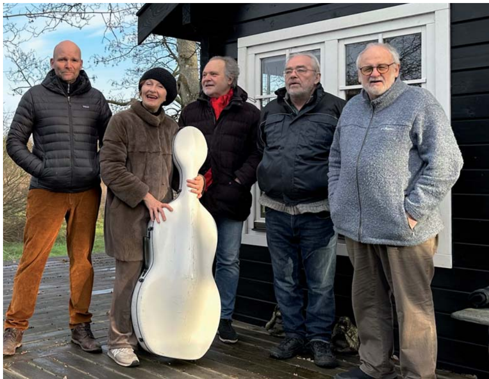
Billedtekstnitivgruppen bag kulturdag på Røsnæs

Kulturdagen på Røsnæs er støttet af "Liv i Kalundborg" og Kultur og fritid ( Kalundborg Kommune)