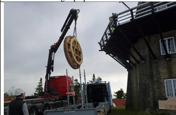
Det ny stjernehjul på 450 kg på vej