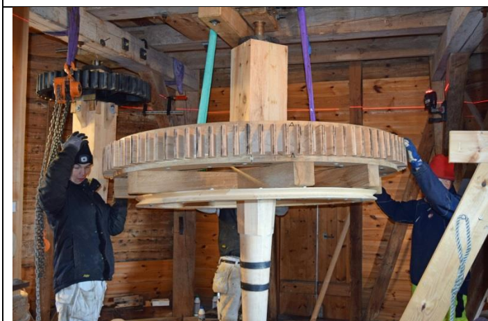
Laseren i arbejde