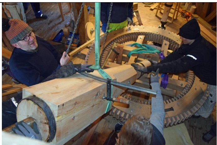
Sikkerheden skulle også være i orden