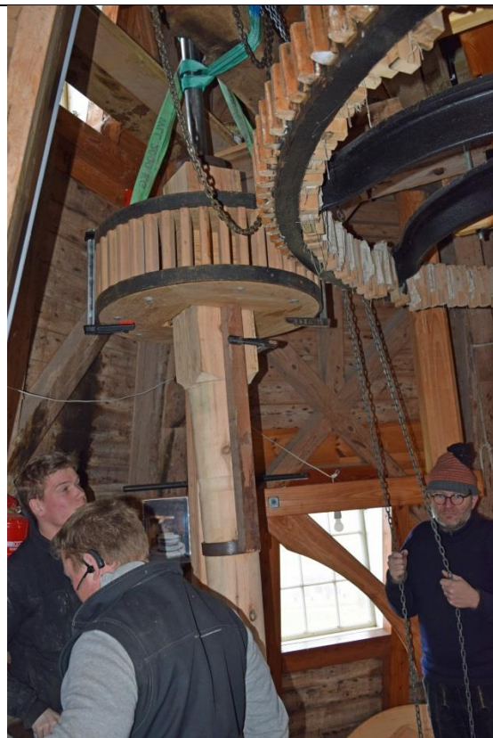
Nu er det lidt spændende hvor godt tændrene i det nye stokkedrev og kronhjulet passer sammen