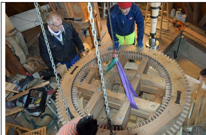
Hjulet, klar til at modtage sin stående aksel