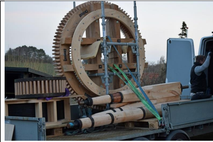
3 møllebyggere og gangtøjet ankommer

Montering i Møllen den 21, 22 og 23 feb. 2023