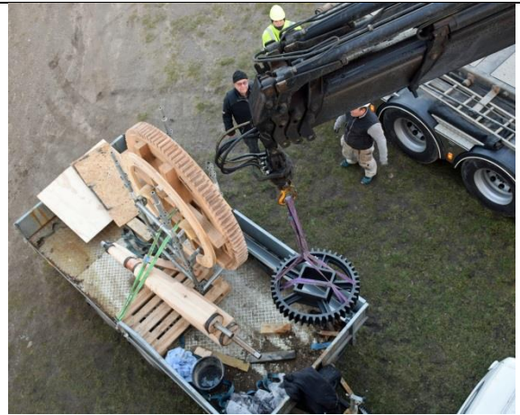
Kranen fra OBEL transport i arbejde