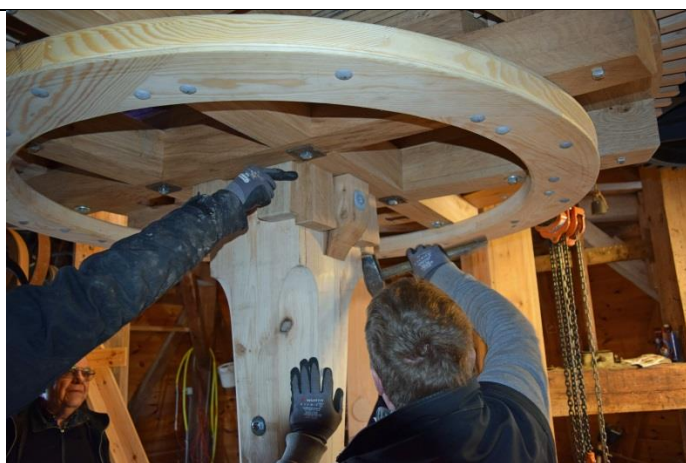
Knæ og kiler bliver monteret