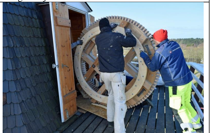
Vi var heldige, kan lige komme gennem døren