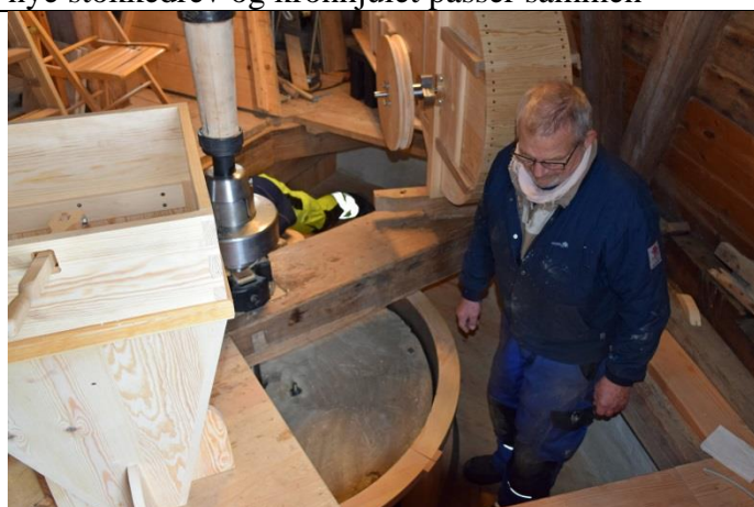
Fineste kvalitet fra øverste hylde

Nu mangler kun et par hundrede timers eftermontage finjusteringer og prøvekørsler så skalkværnen kan meldes klar til arbejde.