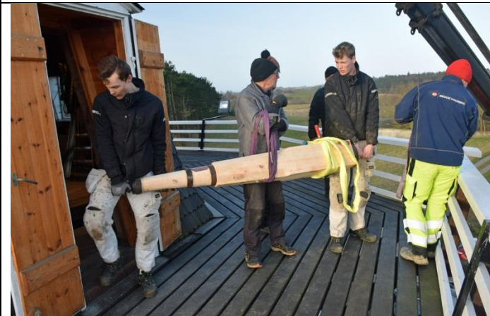
Drivakslerne bringes på plads