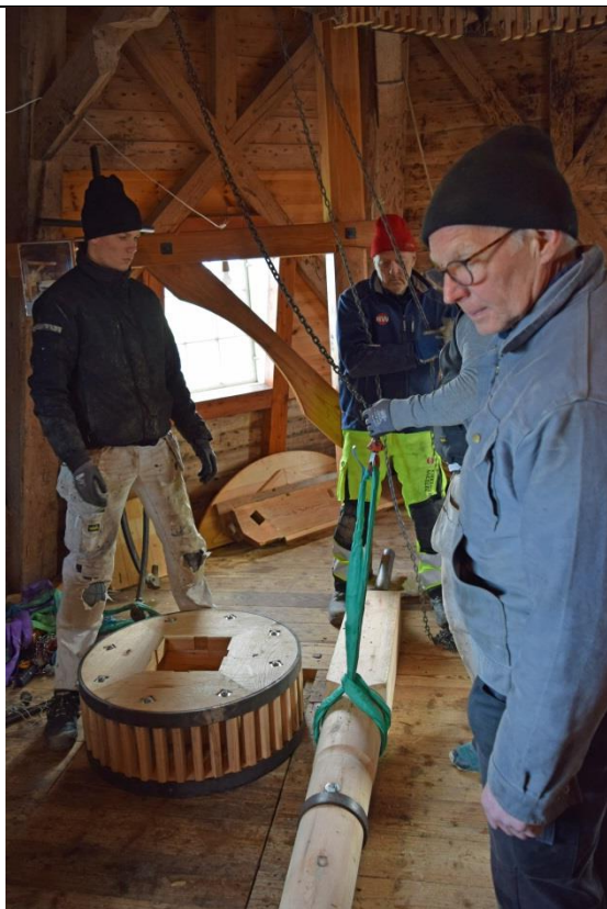
Lidt planlægning er nødvendigt