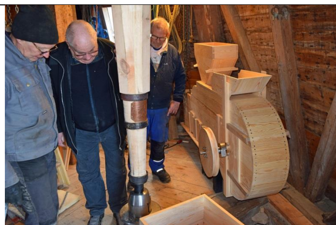
Grynblæseren er også på plads