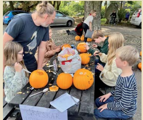
Røsnæs Brugs sponsorerede græskar til udskæring.