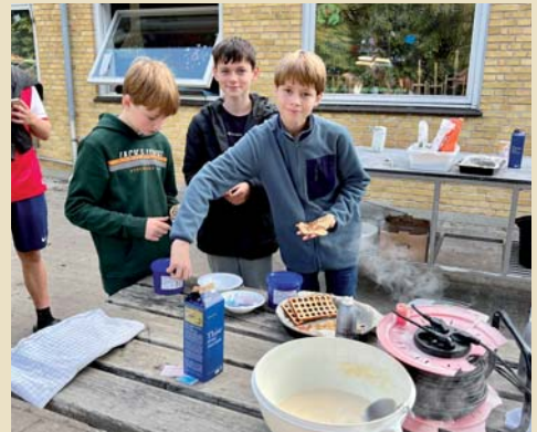
I Madværkstedet blev der bl.a. serveret hjemmelavede vaffer.