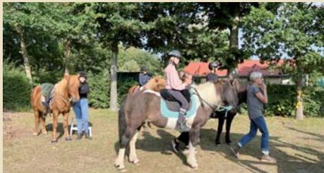
En ridetur på en af de fem heste var et kæmpe hit.