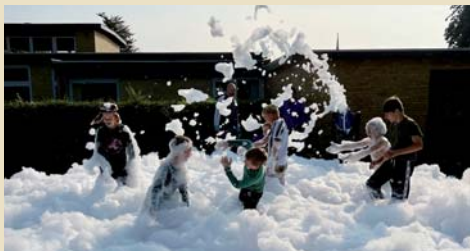
Børnene havde en skum-fest med skumkanonen.