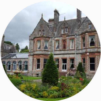
Hôtels de charme