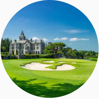
Hôtels haut de gamme