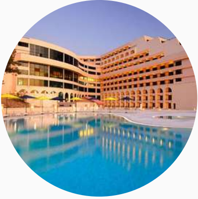
Hôtels haut de gamme