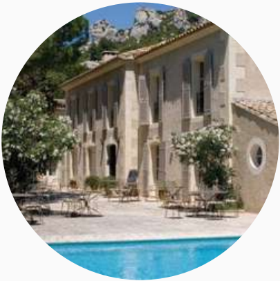
Hôtels de charme