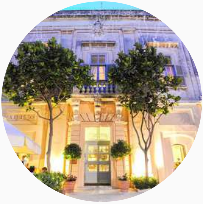
Relais et Châteaux