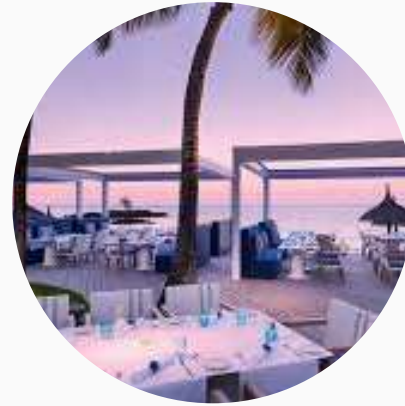
Restaurants de plage