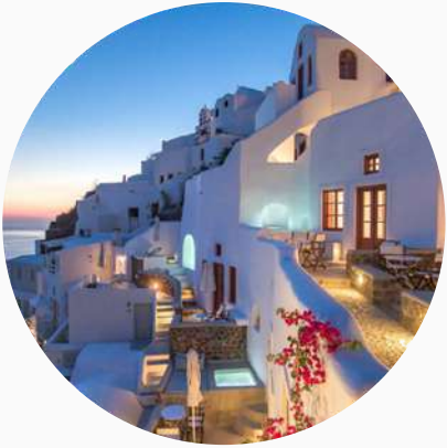
Hôtels haut de gamme