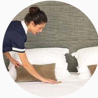
Valet ou Femme de Chambre