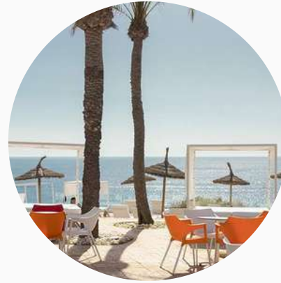
Restaurants en bord de mer