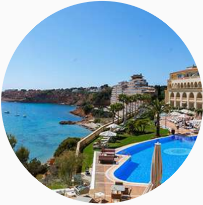
Hôtels haut de gamme