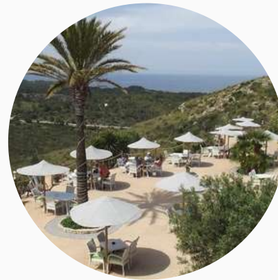
Restaurants en campagne