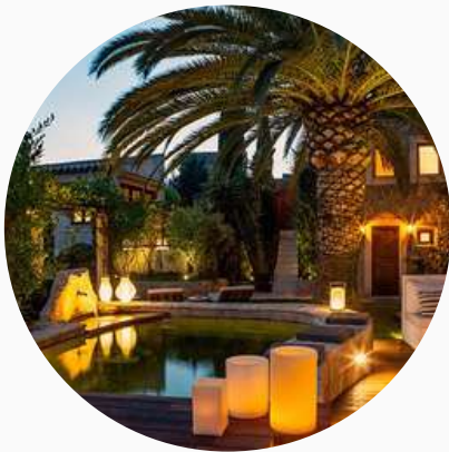
Hôtels de charme