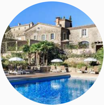
Hôtels de charme