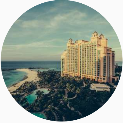
Hôtels haut de gamme