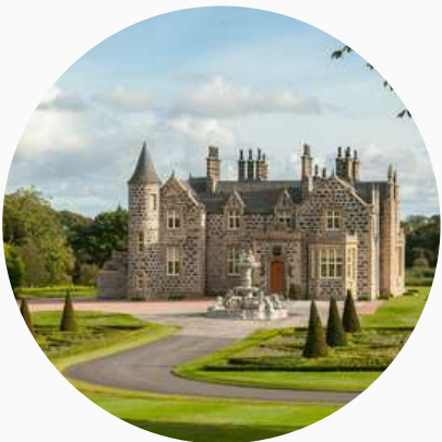
Hôtels de charme