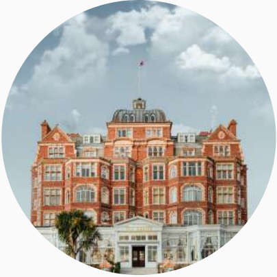
Hôtels haut de gamme