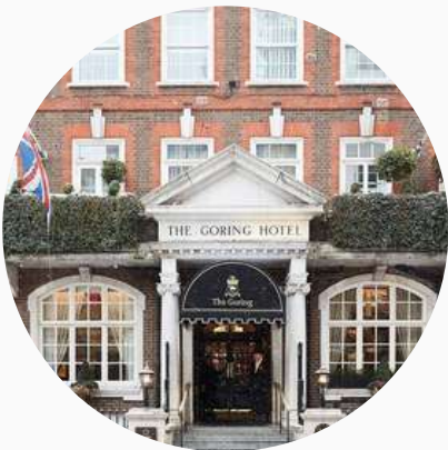
Hôtels de charme