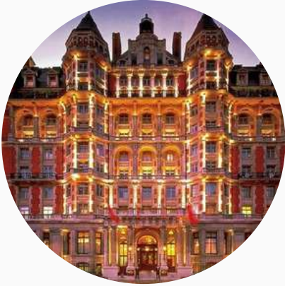
Hôtels haut de gamme