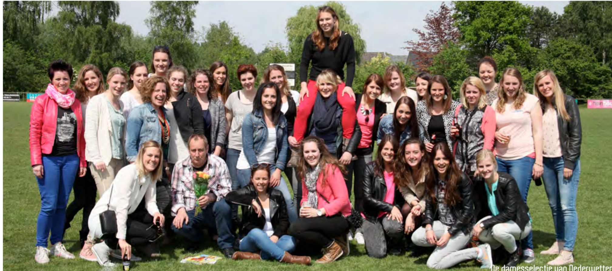
de damessselectie van Nederland

Wat doen jullie bij de opleiding Sport, (media) en economie?