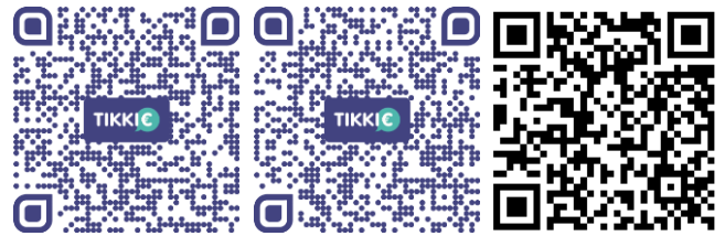
Tikkie Grote Kerk Tikkie Paterskerk Tikkie Smakt

Helpt u deken, de andere priesters en het kerkbestuur en de vele vrijwilligers met hart en ziel te blijven werken voor en aan onze kerk en kerkgemeenschap! Bij voorbaat hartelijk dank!