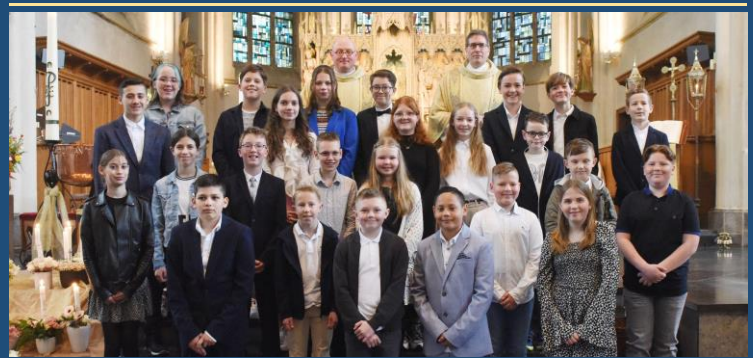
Vormelingen 2023 Grote Kerk, Paterskerk, Leunen en Smakt