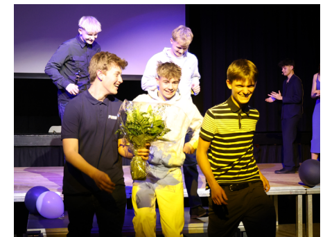
Kattens Filmfestival 2024

Filmfestivalen er en vigtig begivenhed for både skolen, men også for faget, fordi der er noget andet på spil end til en eksamen. Eleverne ranker ryggen, og som lærer føler man sig privilegeret over at opleve det øjeblik. Lige der er skellet mellem skolen og verden udenfor usynligt, og det er også her, mediefaget bliver allermest meningsfuldt: Når elevernes film ikke bare er mål i en læreplan, men også rækker ud over klasselokalets grænser og bliver til værker, der kan gøre en forskel og berøre mennesker uden for skolens mure.