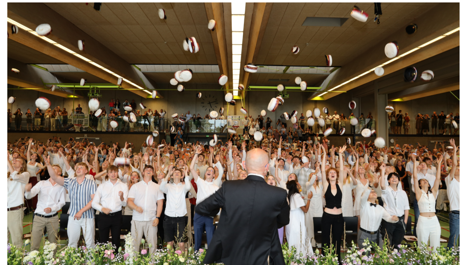
Huekast til translokationen 2023