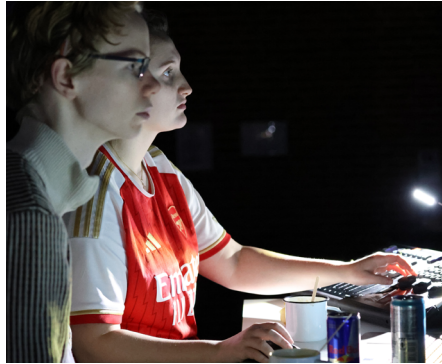
Rose ved teknikbordet