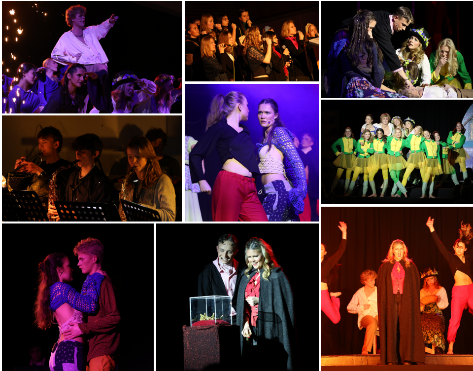
Musical Skammerens Datter 2024