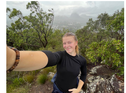
Fie på bjerget Ngungun

Et billede fra et af de sidste hikes jeg tog op ad Ngungun med the Glasshouse Mountains i baggrunden. Bemærk hvor tåget der er. Det er fordi at i januar måned er det "Wet Season" i Australien, så det regnede hele turen op.