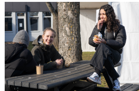
Udeundervisning marts 2021

Åbningen kom gradvis. Måske husker I det lidt spøjse fænomen ”udeundervisning”. Vi snød lidt og lejede telte fra Roskilde Festival, så I trods alt havde lidt læ mod vind og vejr.