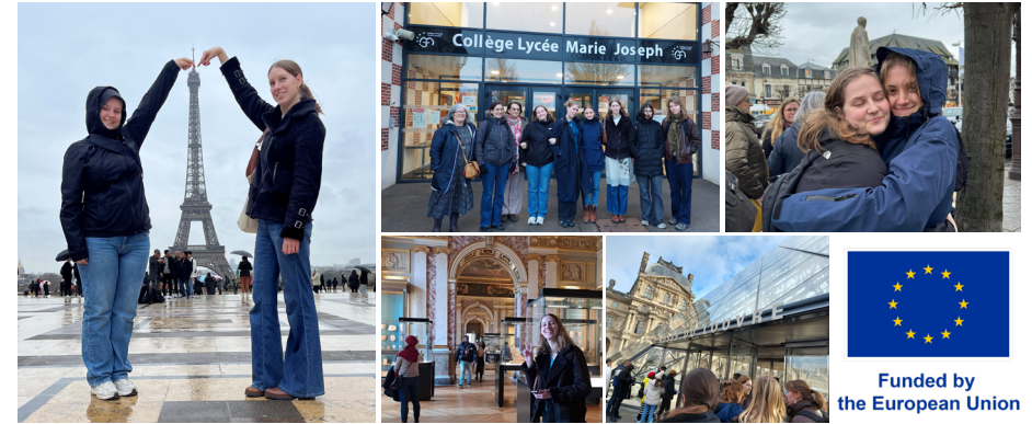
Franskelever fra Europaklassen 3.a på Erasmus-tur til Frankrig, hvor de besøgte en ny venskabskole i Trouville og oplevede stemningsfulde Paris

Det giver input til lærernes egen undervisning og til at reflektere over egen praksis som sprogunderviser. Vi har også haft en række lærere på forskellige kurser i, hvordan man kan udvikle sin sprog- og kulturundervisning. Og