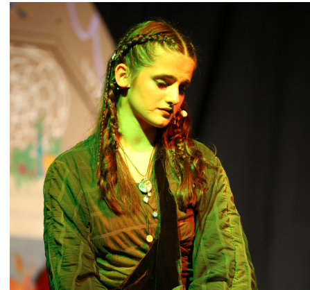
Sofia i Skammerens Datter