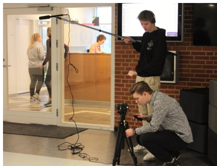
Optagelser på skolen

Allerede fra første modul bliver eleverne i mediefag således sendt ud på skolen for at lave optageøvelser, og som besøgende på RKS vil man på visse dage opleve, at skolens gange og fællesarealer summer af mediefagselever, der med kameraer og stativer forsøger at frame deres optagelser helt rigtigt.