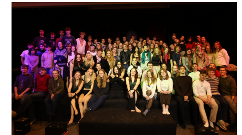
Hele musical-holdet 2024

"For det første for at prøve noget nyt og møde nogle nye mennesker. Generelt har jeg altid elsket at spille skuespil. Det var en mulighed for at få rykket mine grænser, og for at dygtiggøre mig inden for det".