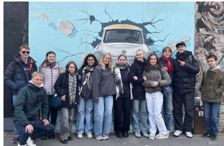
1.g-elever i Berlin

Fordi RKS er akkrediteret, betyder det, at ansøgningsprocessen om økonomiske midler bliver meget nemmere, for vi er på forhånd godkendt. Det gør også, at vi lettere kan sætte gang i flere projekter”.