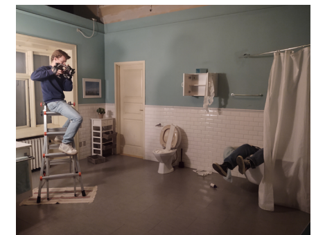
Mediefag B på filmskolen Station Next

De fleste unge i dag ser masser af film og serier, og det er efterhånden en selvfølgelig del af almindelsen at kunne afkode levende billeder og deres effekt. Mediestofet er for længst skrevet ind i flere af de store fags læreplaner på STX. I danskfaget, som jeg også underviser i, skal en fjerdedel af pensum i dag bestå af såkaldt "medietekst". I mediefag er genstandsfeltet netop levende billeder.