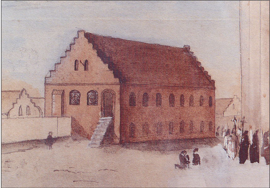
Jacob Kornerups gengivelse af katedralskolen, malet i 1880-erne.