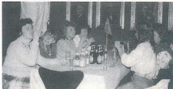
Russere og danskere besøger Carlsberg.

Den største succes blev et landbrug i Osted og Slagteriskolen i Roskilde. Specielt landbruget syntes de var interessant. I USSR er alle landbrug kollektiviserede, så for dem var det meget anderledes at opleve et privat landbrug. Lokal TV'et i Roskilde var derude for at lave et indslag til nyhederne om