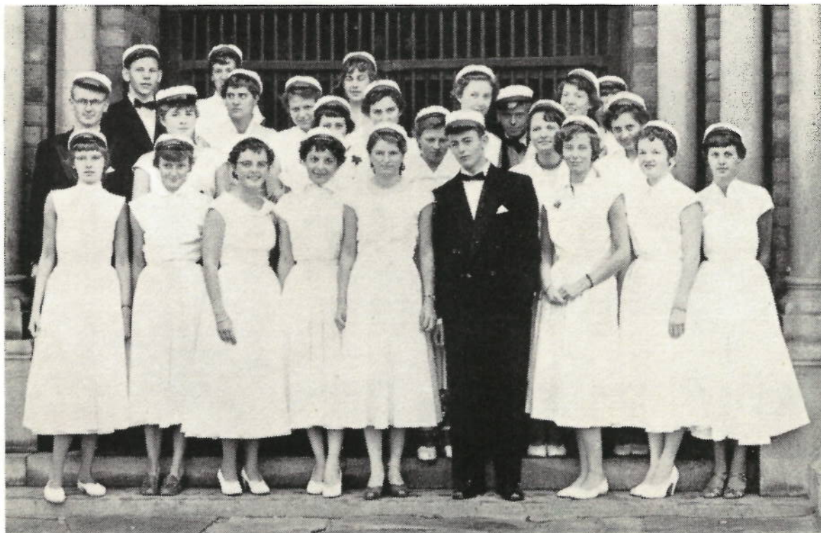
Sproglige studenter 1954.