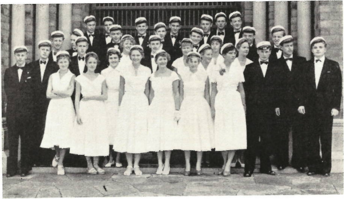
Matematiske studenter 1954.