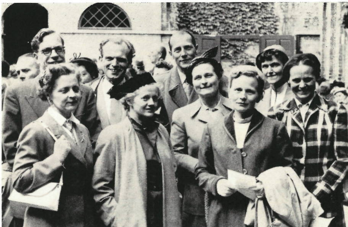
Billedet er taget ved translokationen i skolegården d. 24. juni i år, hvor en del af 25-års jubilarene var til stede. Senere på dagen mødtes de med flere andre af holdet til en privat middag for at fejre jubilæet. Den 24. juni for 25 år siden var de oppe i fransk som sidste fag ved studentereksamen og fik altså netop på samme dato som dette års translokation deres studenterhuer.