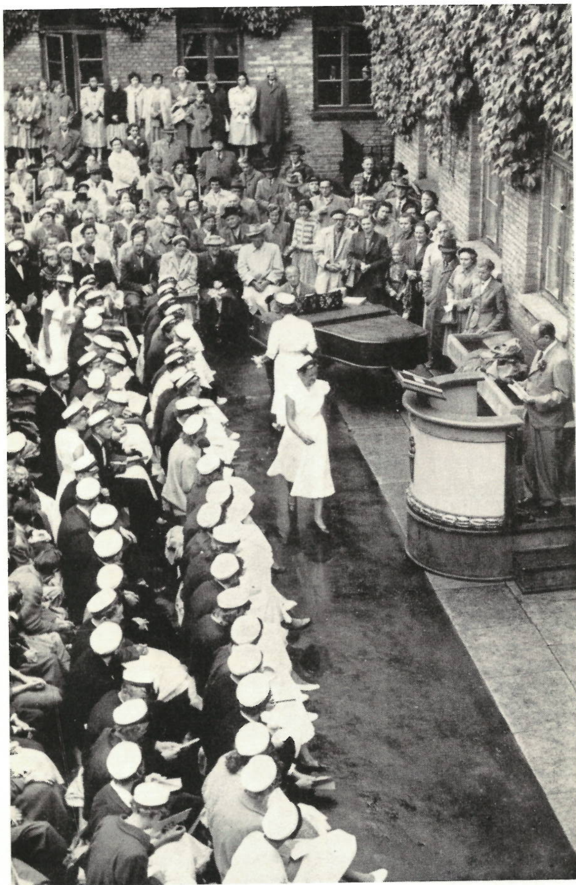
Rektor Fogh uddeler eksamensbeviserne til studenterne