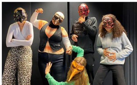
Dramatikelever på RKS puster liv i de klassiske Commedia Dell Arte masker og legemliggør det brogede persongalleri inden for den italienske maskekomedie.

Forløb om den græske tragedie giver eleverne kendskab til den vestlige teatertradition og klassiske dramaturgi, som Aristoteles formulerer i sit værk om digtekunsten; Poetikken. En dramaturgi, som danner norm den dag i dag inden for både film, litteratur, fortællende journalistik og scenekunst under betegnelsen berettermodellen.