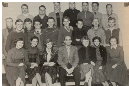
Matematisk naturvidenskabelig klasse B

i klassen, på skolen og i elevforeningen Rhoar, og hurtigt udviklede vi et varmt fællesskab og et enestående kammeratskab. Skolen var så lille og med så mange elever, at vi alle kom tæt på hinanden.