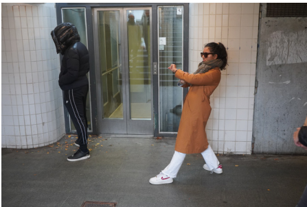
Billedet er fra flash mob 'Forskydninger' skabt i samarbejde mellem Egnsteatret Aaben Dans, øvelokaleforeningen Råstof Roskilde og dramatikfaget på Roskilde Katedralskole.

Den travle pendler på Roskilde Station løber forhastet gennem tunellen op til sporet, hvor toget allerede ruller ind på perronen og hvin fra skinnerne blander sig med en sfærisk og ukendt lyd i den trange underjordiske passage. "Check ind, check ind - check ud!" lyder en genkendelig mekanisk kvindestemme pludselig midt i den elektroniske komposition og pendleren stopper op. Kigger på en stillestående skikkelse, som er stivnet i en løbende bevægelse. Som pendleren selv. En forskydning midt i hverdagen. Som rusker op i den travle rejsende og får personen til at reflektere et øjeblik – for hvad er det egentlig jeg løber efter...?