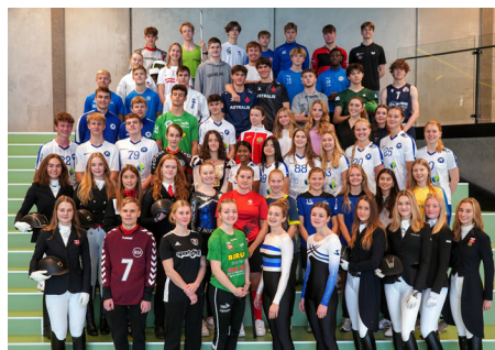
Fællesbillede af Team Danmark- og eliteidrætslever

”Det er rart at være på en skole, hvor der er stor forståelse for, at hverdagen som elitesportsudøver i nogle perioder er ret presset.