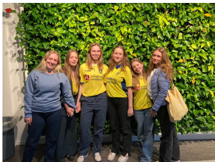
Elever klædt ud i gult og blå for at støtte Ukraine

Til gengæld fylder situationen i Ukraine.