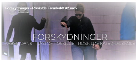
Stillebille fra videoen 'Forskydninger - Roskilde Fremkaldt', produceret i samarbejde med Roskilde Kommune. Videoen dokumenterer den 'flash mop' 'Forskydninger', som var et resultatet af et kunstnerisk samarbejde mellem Egnsteatret Aaben Dans, ovelokaleforeningen Råstof Roskilde og dramatikfaget på Roskilde Katedralskole.

Det er altid til stor morskab for alle, når eleverne prøver kræfter med de legesyge ordspil og sproglige labyrinter i Slutspil, Vi venter på Godot og Den skaldede Sangerinde i undervisningen.