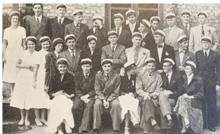
29 matematiske studenter