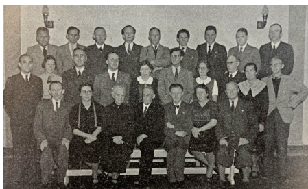
I 1942 er Roskilde Katedralskole blevet en stor skole – der er for øjeblikket 425 elever.