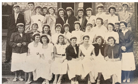
30 nysproglige studenter