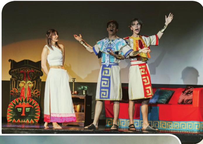
Billeder fra El Dorado.

Atter en flot musical blev føjet til den lange liste af vellykkede musicals, der i årenes løb er vist på scenen i skolens festsal.