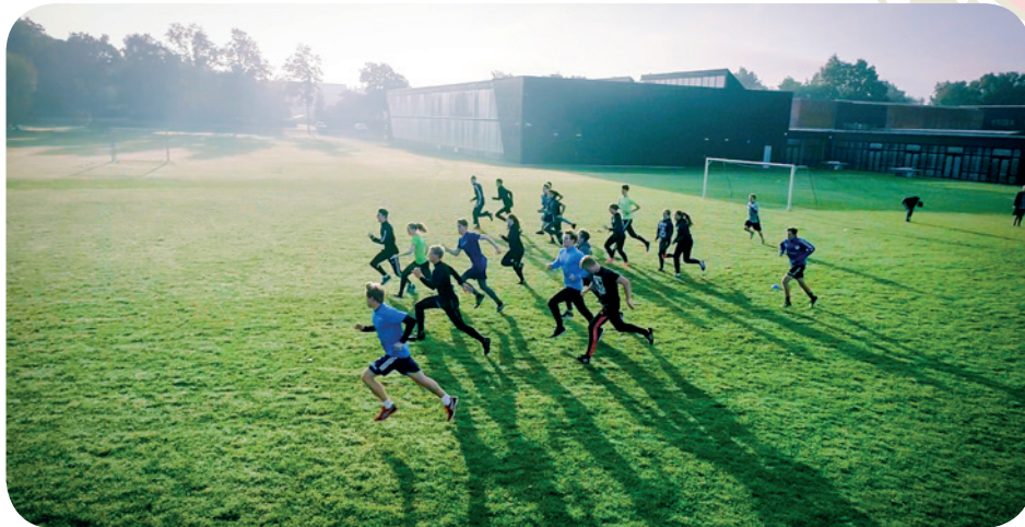
Idræt på plænen foran sportshallen.

Flere end 12.000 studenter er dimitteret fra Roskilde Katedralskole, siden gymnasiet flyttede til Holbækvej. For dem er Katedralskolen skolen på Holbækvej. Det mærkes tydeligt, når skolens elevforening Roskildenser-Samfundet holder sin årlige jubilæumsfest den 2. lørdag i juni, hvor skolens mange tidligere studenter mødes for at gense hinanden og den skole, der gennem tre år har været ramme om deres liv.