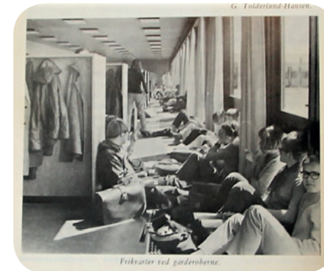
Prøvetimer ved gaderobberne.

Anerkendelsen i 1995, da domkirken kom med på FN-organisationen UNESCO's liste over 'verdens kulturarv', har givet helt nye muligheder, som endnu langt fra er udnyttet. Roskildes domkirke er nu blevet så internationalt kendt, at gæster fra hele verden kommer og besøger byen, hvor de samtidig vil handle, spise og sove.