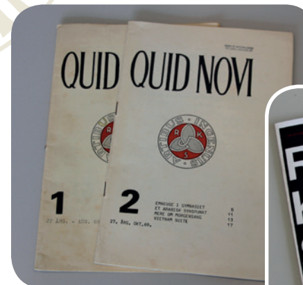
Quid Novi-blade fra 1969