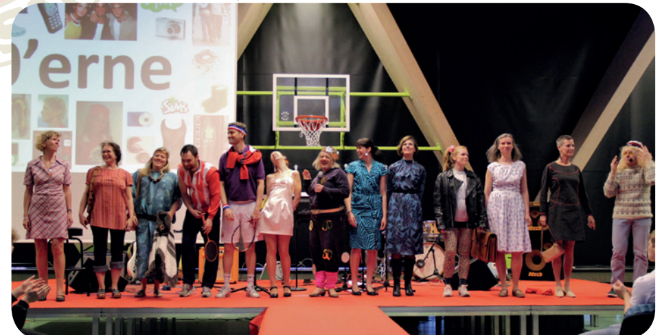
Nedenfor: Lærere under modeshowet.