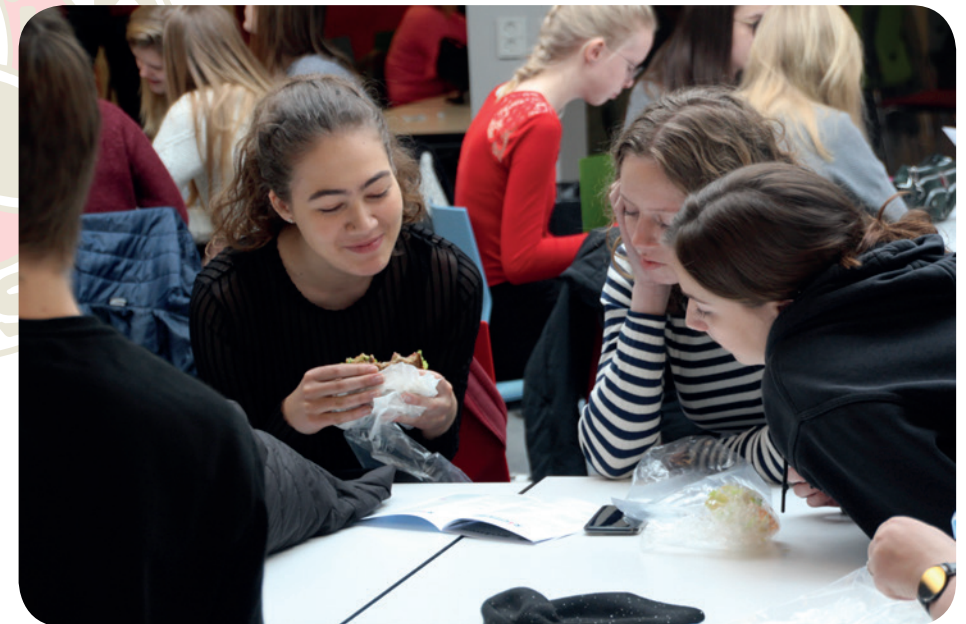
Elever læser RåKoSt i spisepausen.

Så for at undgå, at eleverne bliver forstyrret i timerne og ikke kan følge med i undervisningen, men samtidig lade dem i nødvendige tilfælde komme i kontakt med omverdenen, så ville en optimal løsning være at pakke telefonerne væk i timerne, men uden nødvendigvis gøre skolerne helt mobilfri – fordi de alligevel, i dagens Danmark, er blevet en del af mennesket.