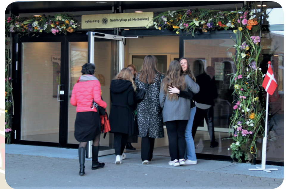
Ovenfor: Æresport foran hovedindgangen til Katedralskolen.