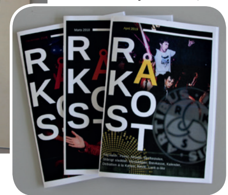
RåKoSt-blade fra 2018-19