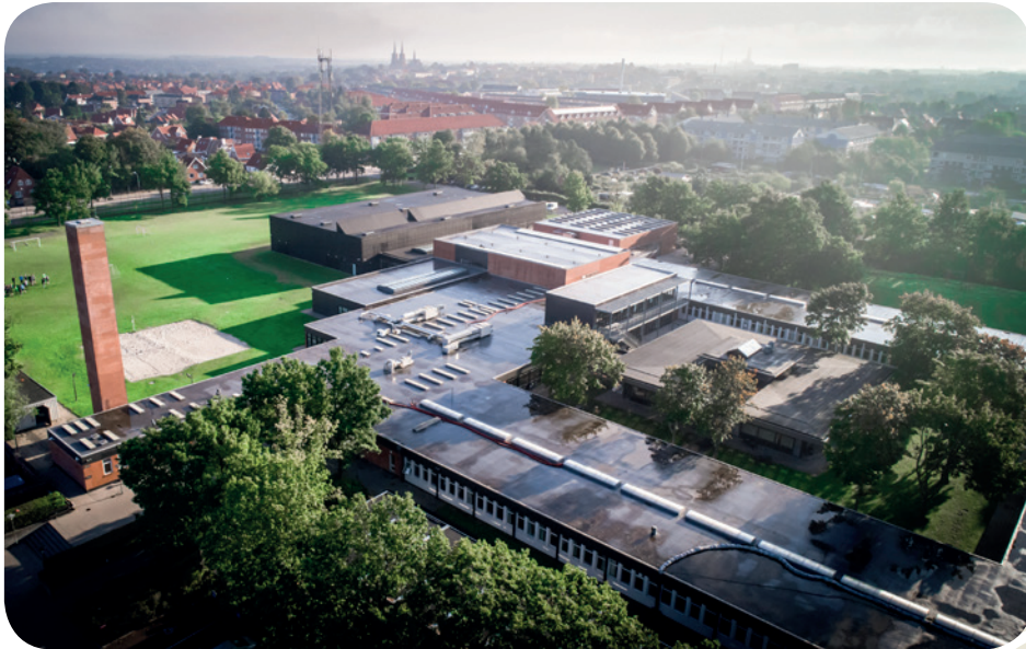
Ovenfor: Luftfoto af Roskilde Katedralskole 2017. Nedenfor: Luftfoto af Roskilde Katedralskole 1970.