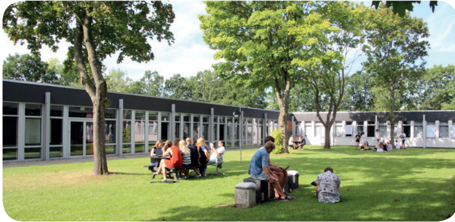
Atriumgården på en sommerdag.