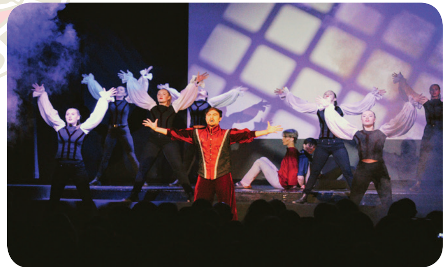
Billede fra El Dorado.

Det store band akkompagnerede meget dygtigt både sangerne og det flot syngende kor på mange forskellige instrumenter og