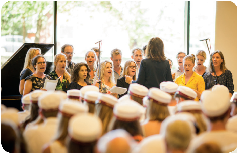
Lærerkoret synger 'Danmark nu blunder den lyse nat' til translokationen.

gælder alle de aktiviteter, der foregår på RKS.