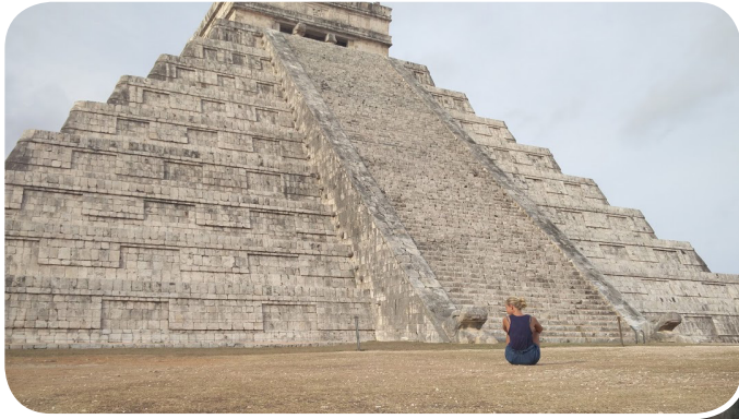
Til venstre: Chichen Itza i det sydlige Mexico. Nedenfor: Macchu Picchu i Peru.