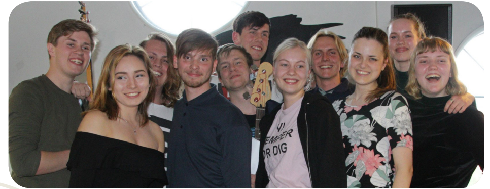
Eleverne fra MusiCreator

Hertil kommer politikere, der hele tiden presser på med besparelser og effektiviseringer af hele uddannelsesområdet, særligt i en tid, hvor samfundet som nævnt ændrer sig med voldsom hastighed.