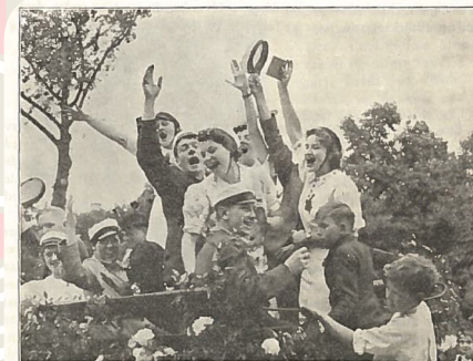
De ny Studenter