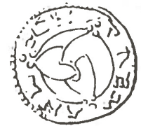
Triskellen: Motivet stammer fra nogle af landets første mønter slået i Roskilde for ca. 1000 år siden. Roskildemønterne er karakteriseret ved de 3 overlappende skjolde, der måske er et treenhedssymbol.

være Roskildes ældste uddannelsesinstitution – har en vis andel i.