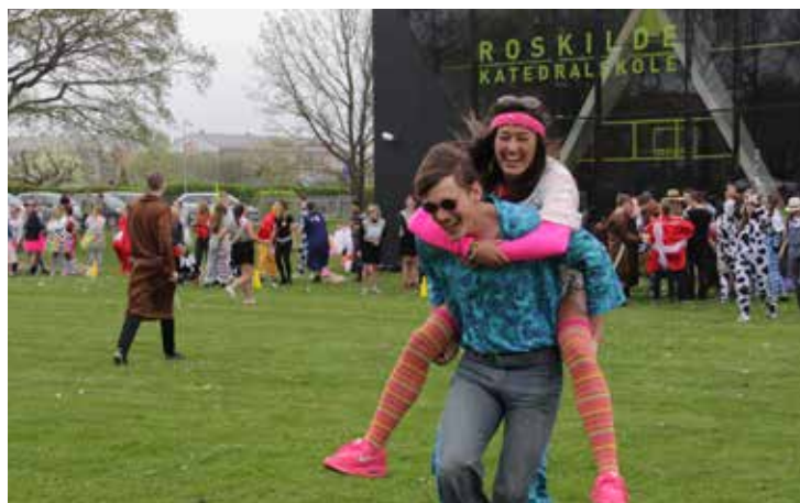
👉 Mange holder fast i de stærke venskaber, der opstår i gymnasietiden.