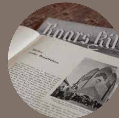
⤴ "Skolen under besættelsen" fra Årsskriftet Roars kilde