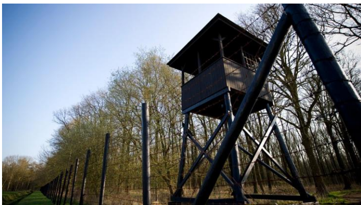
Wachtershuisje in Kamp Westerbork.

Siertsema onderzocht de memoires van joodse verzetsheld Ies Spetter. Ze achterhaalde volgens dagblad Trouw dat Spetter en Hillesum samenwerkten in Kamp Westerbork om kinderen te bevrijden.