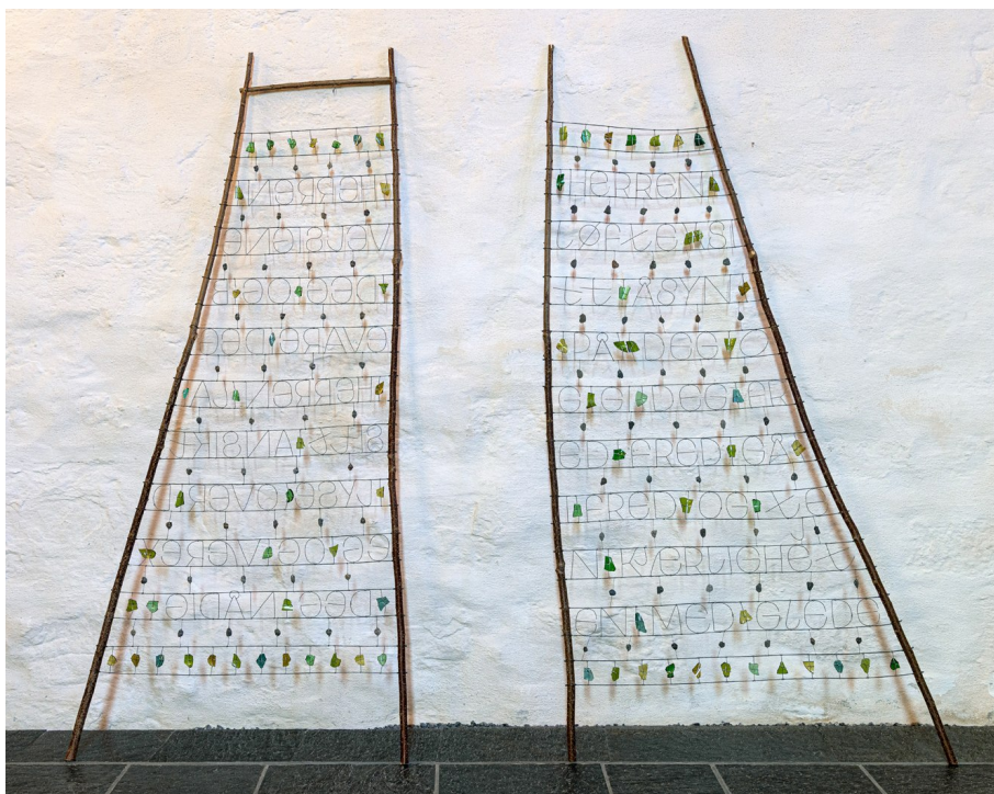
Demongerbar installasjon; hasselkjepper, ståltråd og glass. Arbeidet er tenkt som interaktivt verktøy for å kunne gi og motta velsignelsen. Tre personer deltar av gangen, to velsigner og én mottar og så bytter man posisjoner.