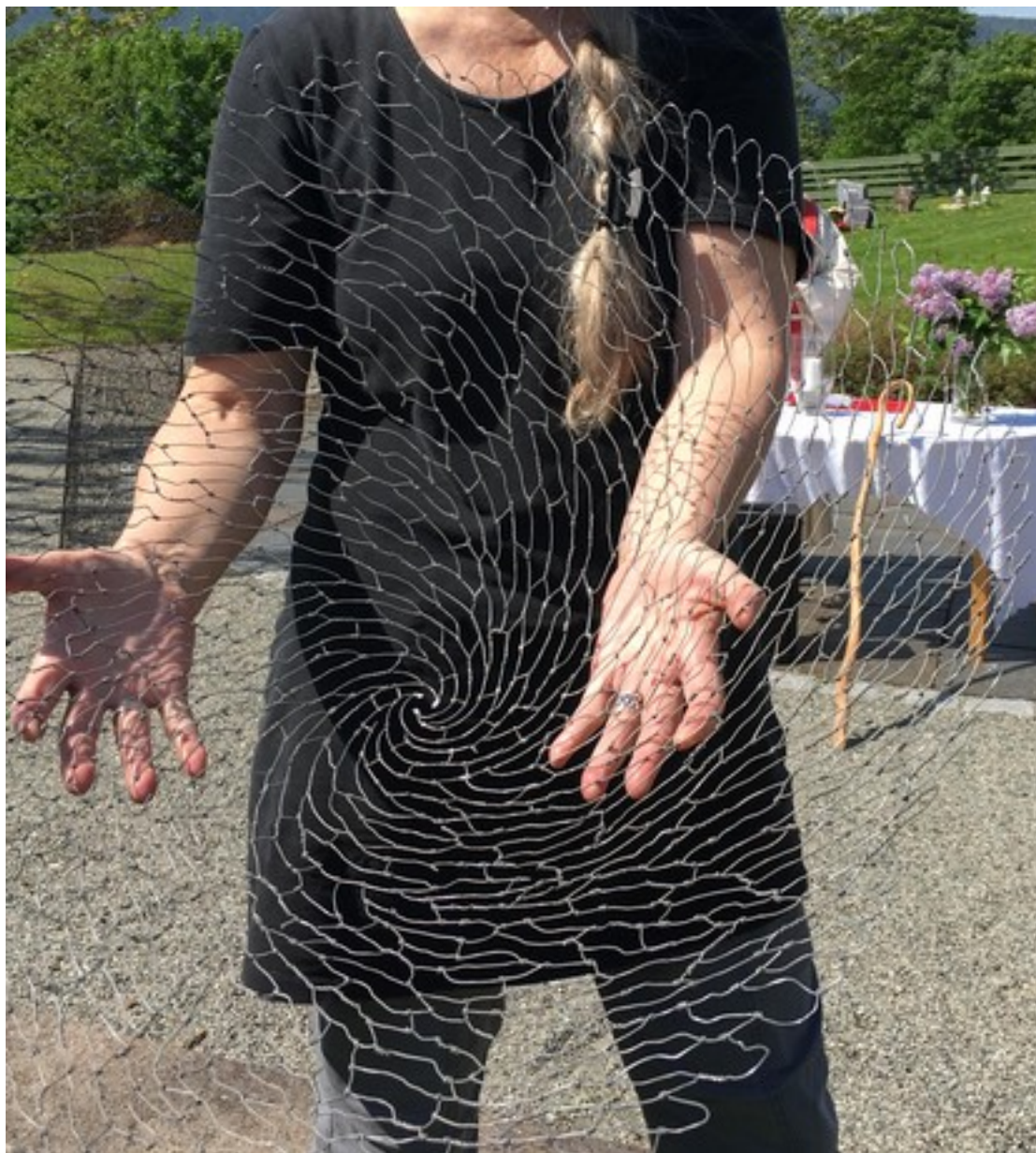
Figur 3. Fat

Produksjonsår: 2000 (foto fra 2018, Tranby kirkegård, Lier)