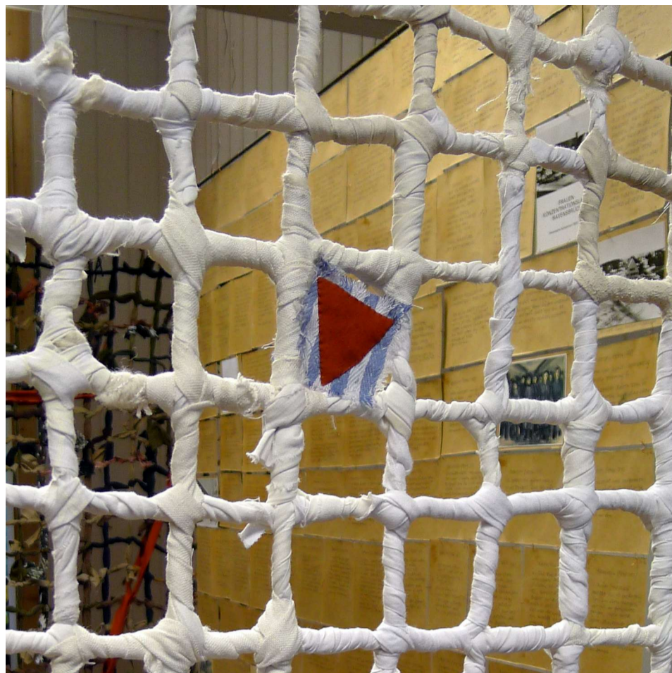
TANTE VIVI fange nr. 24127 Ravensbrück