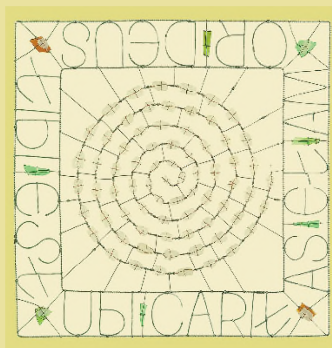
The way of Christ - The way of Dao , udsnit (metaltråd/glas o.a.).