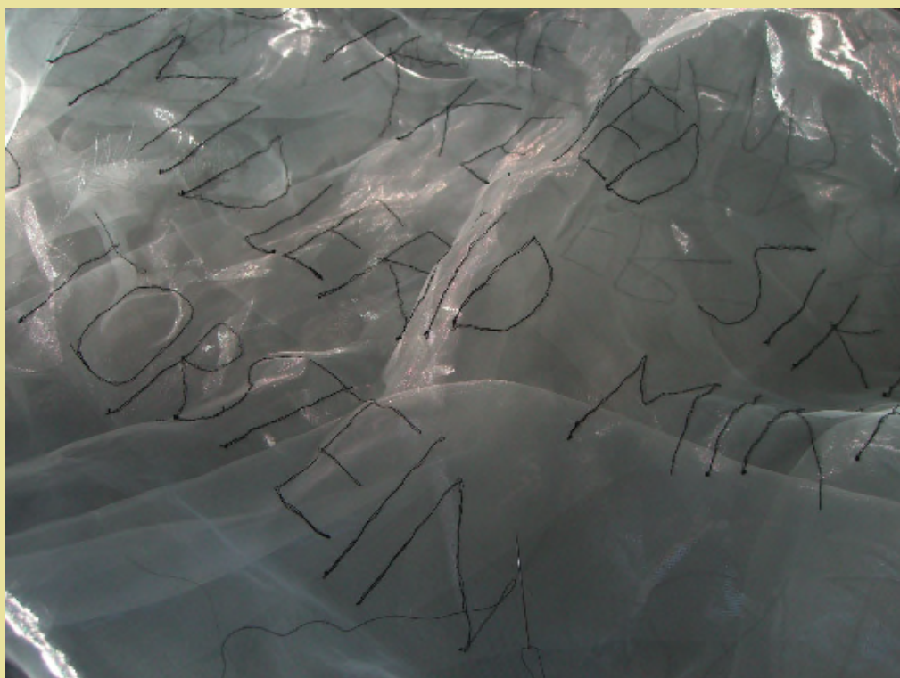
Torstein (broderi).

Barbro Raen Thomassen (Norge) benytter forskellige kunstneriske virkemidler.