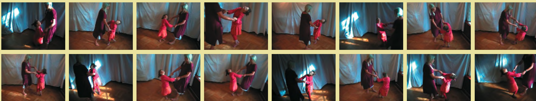
Synnøve danser - en anden samfundsorden (film).

Marianne Rønnow (Danmark) er uddannet på Danmarks Designskole i København.